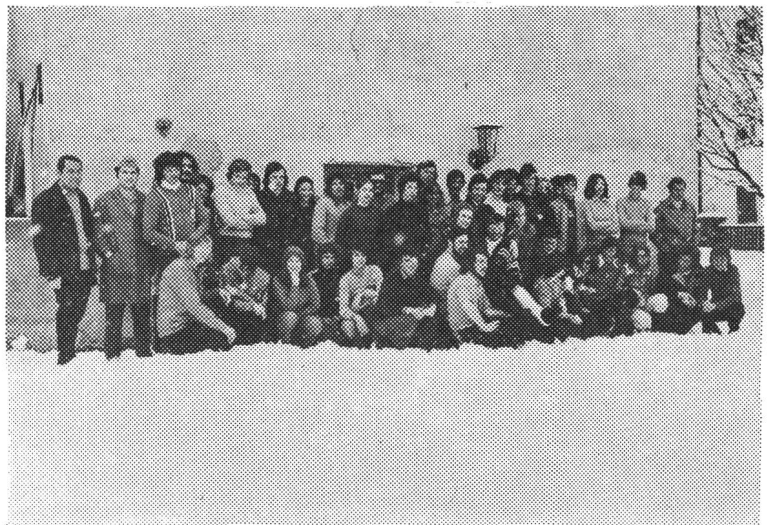
I partecipanti al riuscito corso del Club alpino

Il corso era alloggiato nell'attrezzatissima Ca' Montana di Rona. Comodi dormitori riscaldati, ampi locali, docce e servizi igienici ed una moderna cucina sono le componenti di un'azzeccatissimo investimento da parte della «Fondazione Ca' di Rona» di Breganzona.