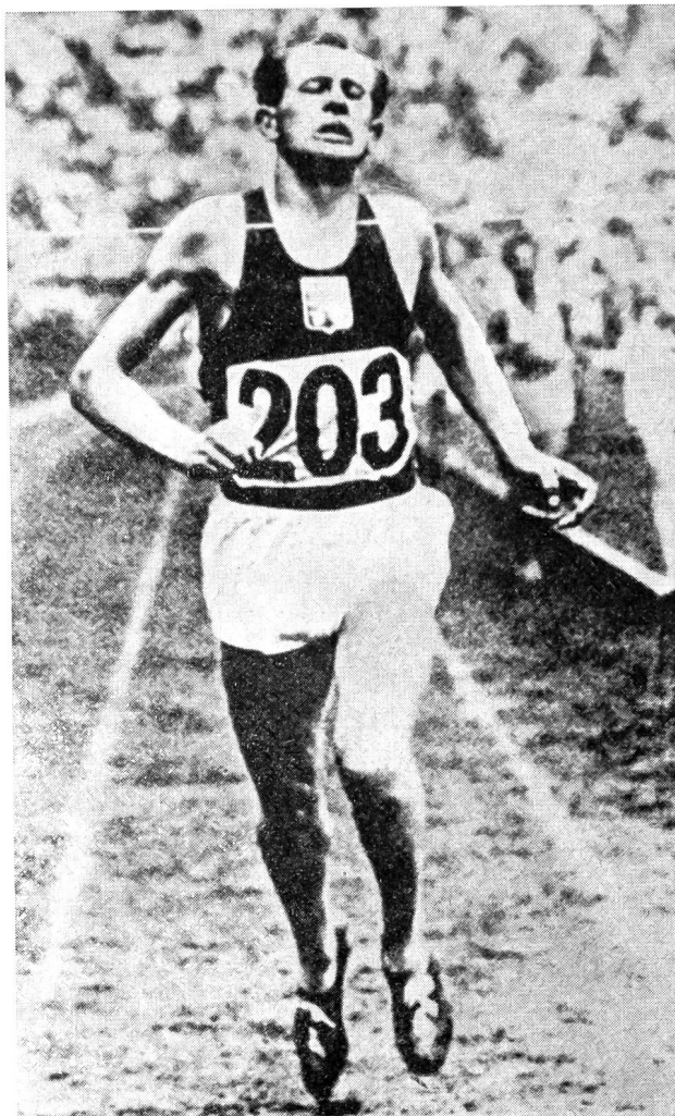
Zatopek, uno degli atleti che si sono «fatti» da soli!