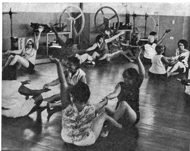
Ginnastica femminile in un centro di quartiere

Quanto alle premesse, esse mirano ai seguenti scopi: stabilire che poco importa che un paese sia piccolo e provare che gli sportivi americani non hanno una qualità