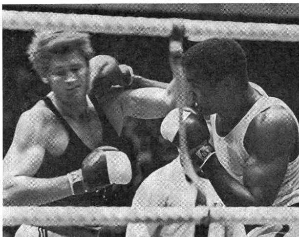
Teofilo Stevenson (a destra) opposto al tedesco occidentale Peter Hussin a Monaco

muscolare superiore. Si tratta, in un certo qual modo, di smascherare gli dei dello stadio nordamericano, di ridare ai popoli dell'America latina fiducia nelle loro possibilità e dar loro per mezzo dello sport una dignità appassita da un «colonialismo» larvato.