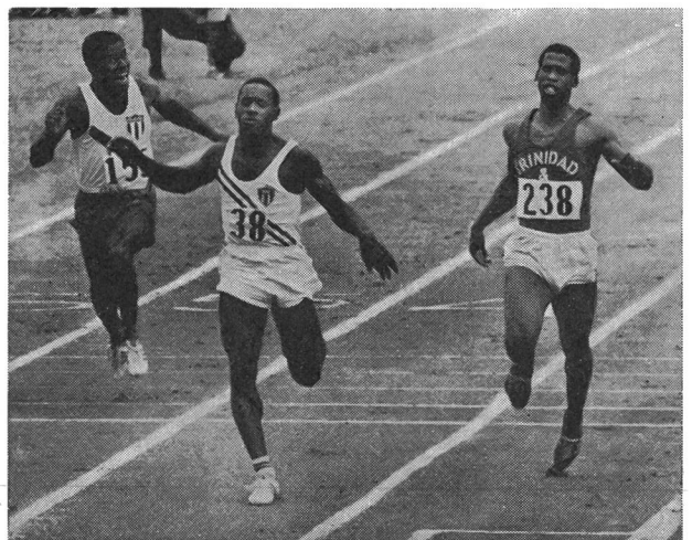
Figuerola (38): conquistò la prima medaglia olimpionica per Cuba, dopo la rivoluzione

Ma il principale apporto dello sport cubano ai paesi dell'America latina si trova senza dubbio nella creazione delle prove LPV.