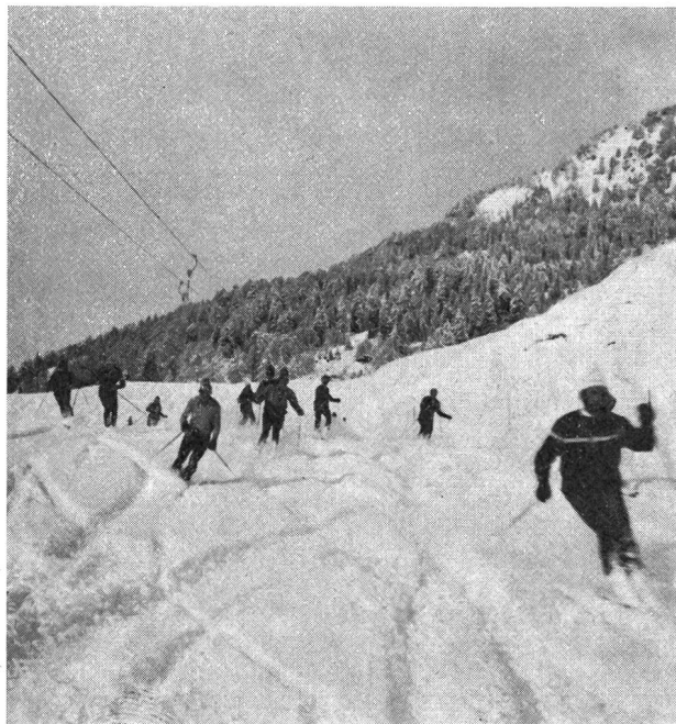
Futuri monitori G+S al lavoro pratico

Blenio e alla dir. della FLOC di Locarno-Cardada per la comprensione e lo spirito di collaborazione dimostrati, mettendo a disposizione, esclusivamente dei corsi G+S, gli impianti di risalita, dando in tal modo un contributo tangibile e concreto agli organizzatori. Secondariamente non possiamo esimerci dall'estendere un vivo plauso agli istruttori, già citati sopra, grazie ai quali è stato possibile offrire ai partecipanti un insegnamento qualitativo e tecnicamente pregevole. Inoltre degli istruttori va messo in giusto rilievo il loro senso di dedizione che li ha portati parecchie volte a restare operanti fino a tarda sera. Queste prestazioni spontanee e disinteressate dovrebbero essere maggiormente comprese e valutate anche dai nostri superiori!