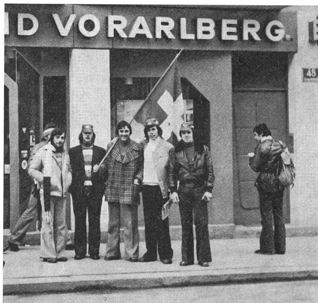
Sano tifo svizzero per le vie di Innsbruck.

Gli elvetici hanno terminato la trasferta tirolese con risultati inferiori alle speranze (non si pretendevano i risultati di quattro anni or sono, con le dieci medaglie di Sapporo, ma si attendeva qualcosa di più) in quanto hanno deluso le ragazze: sulle loro prestazioni, a mano dei risultati della preparazione e delle gare preolimpiche di coppa del mondo e di Europa, era lecito (e giustificato) attendersi qual-