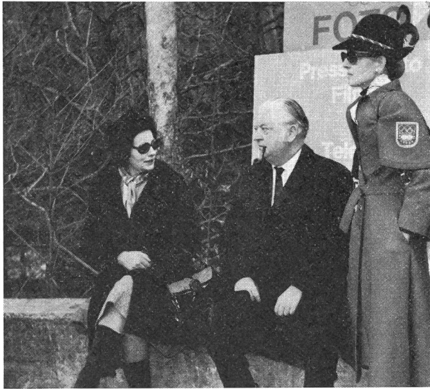
«Il protocollo vada a... quel paese» sembra essersi detto il presidente del CIO, Lord Michael Killanin, il quale, in attesa del cerimoniale per l'apertura dei Giochi non rifiuta di sedersi su un muricciuolo con la moglie, sempre assistito dalla «hostess» a lui assegnata.

ve decisive), si indaga per conoscere il parere degli atleti, si sono messi i concorrenti di nuovo in lizza, in primo luogo con i campionati nazionali. Ed è consolante constatare come, con ripetuti insuccessi, c'è chi confessa di non aver più pretese per il futuro («ormai sono vecchio, non so più sciare, attacco gli sci al chiodo» ha affermato Gustavo Thoeni) mentre altri intende ritirarsi ancora in bellezza (Walter Tresch): e c'è pure chi, malgrado la sfortuna, non si sente ancora di abdicare (meraviglioso ricupero di Roland Collombin), mentre altri non vuole pronunciarsi su quanto potrebbe riservargli il futuro (Bernardo Russi, ed a giusta ragione in quanto saranno le risultanze delle cure mediche a provocare l'attesa decisione del bravissimo e intelligente corridore di Andermatt, che non accusa l'avanzarsi degli anni).