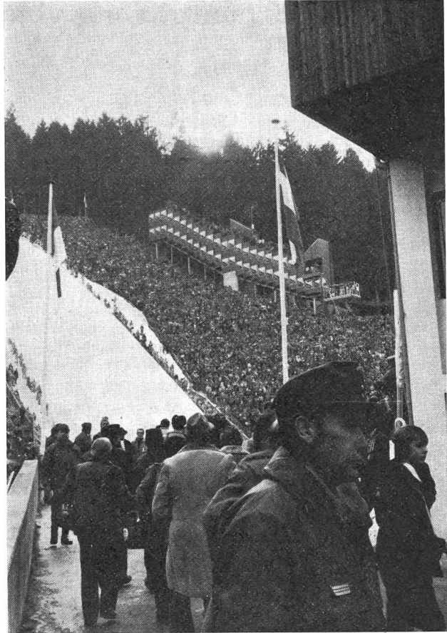
La folla: una impressionante visione di parte degli spettatori che si sono recati al Bergisel per la cerimonia di apertura dei GO di Innsbruck 1976, alcuni già dalle otto del mattino (la cerimonia ha avuto inizio alle ore 14.30 e vi hanno assistito, per ben due ore, oltre 70 000 appassionati degli sport invernali. Tanto può lo sport...).

che medaglia: che non è venuta (specie dalle slalomiste, che si erano distese nella tranquillità di Schuls/Scuol, la «porta di Olimpia» come era stata denominata la nota stazione termoclimatica della Bassa Engadina siccome a soli 13 km da Innsbruck e l'ultima località importante in Svizzera) e su cui si sta indagando alla ricerca di qualche causa che possa servire quale giustificazione. Noi crediamo e pensiamo che a Innsbruck si sia giunti quando la curva della forma era già, quasi per tutti gli atleti, in fase discendente: nel mese di gennaio, intensissimo di competizioni, gli atleti — qualcuno magari per conquistare la selezione — hanno dato tutto e si sono, come si suol dire, sponpati: ed è quindi naturale che sulle piste olimpiche non abbiano più potuto dare il massimo; contrariamente a altri che, magari, si sono risparmiati, e qui affiorano i nomi di Heini Hemmi e Ernst Good, unitamente a Russi, e sono sbocciati in pieno sulle nevi di Axamer Lizum.