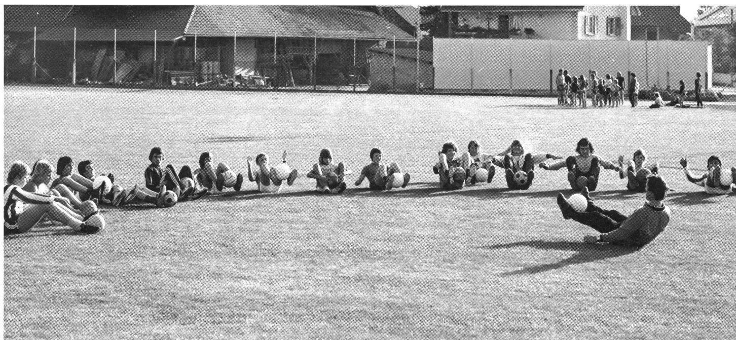
Tabella 1: ripartizione (in cifre assolute) degli allenatori federali della Germania e della Svizzera, per quel che concerne la loro attività come sportivi di competizione a livello di prestazione regionale, nazionale e internazionale.