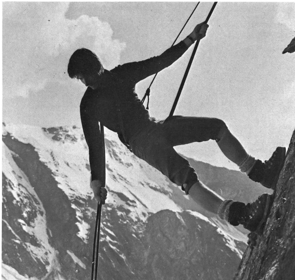
L'istante in cui ogni gesto impegna la sorte di tutti. La corda: un legame che simbolizza la sicurezza e che permette di vivere «la vertigine delle profonde distanze».

Altrimenti detto una amara pillola deve essere ingoiata per gli iniziatori dell'idea di G+S. Questo piano nel campo delle restrizioni è il secondo e fa seguito a quello preso nel 1975; a giusta ragione è considerato inquietante per diverse ragioni.