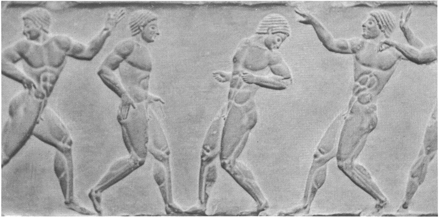
Giocatori di palla ellenici attorno al 500 a.C. Scultura nello zoccolo di una statua di Atene.

prendendo la palla e giocando a volte con più attrezzi. In occasione dei concorsi il perdente riceveva, per derisione, il soprannome di «asino» e doveva portare sulle spalle il vincitore. Con la palla si facevano inoltre numerosi esercizi di equilibrio: nei lanci e nelle prese descritti da Omero, bisognava eseguire diverse forme di salti durante il volo della palla; si contava il numero delle prese. Un'altra forma di gioco era inoltre applicata, collettiva questa: due squadre si fronteggiavano, divise dalla linea mediana al centro della quale era posata una palla. Al segnale le due squadre si precipitavano sulla palla che bisognava afferrare e lanciare oltre la linea che delimitava il fondo del campo avversario. Un gioco analogo, denominato «harpastum» si praticava a Roma, ma con una piccola palla dura. Il filosofo popolare Epitakos (50–135 dopo Cristo) criticava duramente questo divertimento la cui violenza – diceva – assomigliava più a un combattimento che a un gioco.