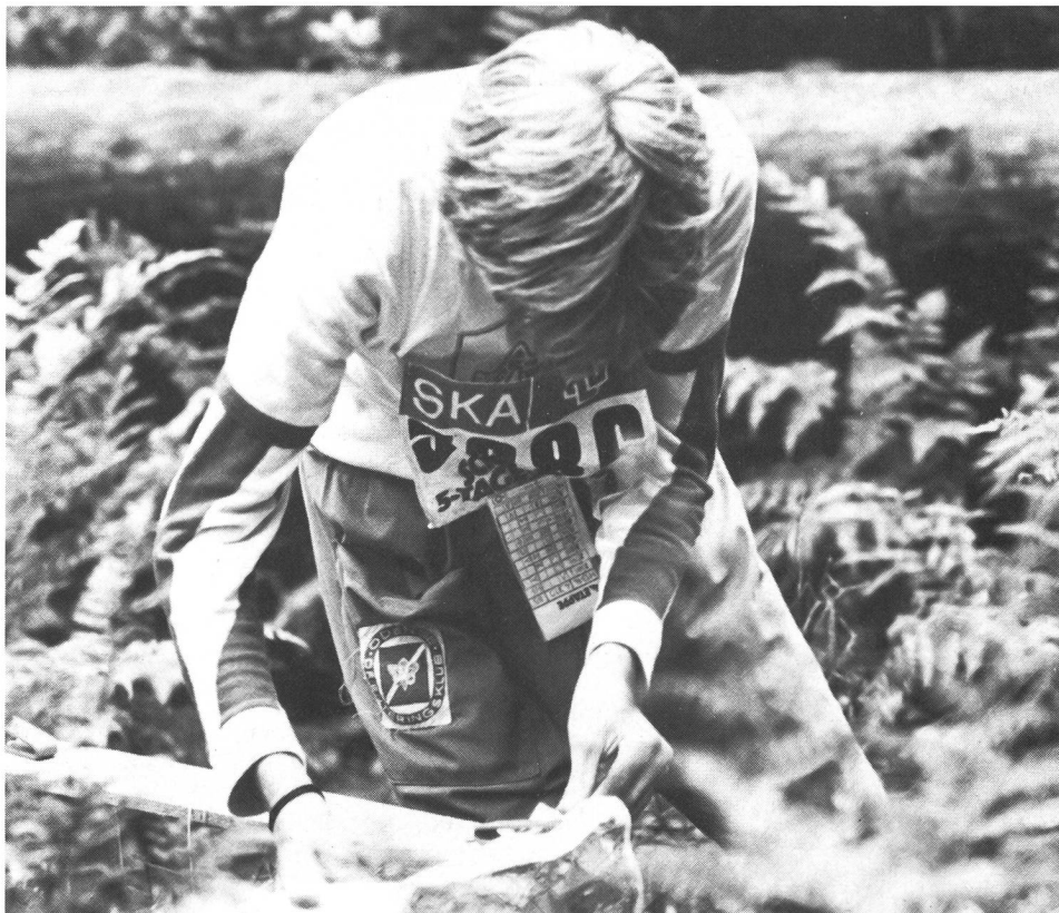
Nello sport: da che parte andare?

essere riconosciuto socialmente a parte intera con diritto di retribuzione professionale. Dunque un membro indiscriminato del nostro sistema sociale. In taluni paesi la «copertura» della carriera sportiva di un atleta di punta (che è sempre limitata nel tempo) è assicurata. Se non si trovano soluzioni adeguate a livello di CIO e federazioni internazionali, c'è il rischio che l'affare passi sotto monopolio commerciale. Non si tratta più di dibattere la questione del dilettante e del professionista, bensì di rappresentarsi il valore dell'Uomo anche nel mondo dello sport. Il futuro dello sport non dipende dallo sport del futuro, da nuovi primati, tecniche o impianti. Lo sport deve cercarsi nuove frontiere, quali saranno lo si può solo immaginare. Ma come recita un vecchio adagio: il solo prevedibile è l'imprevisto. □