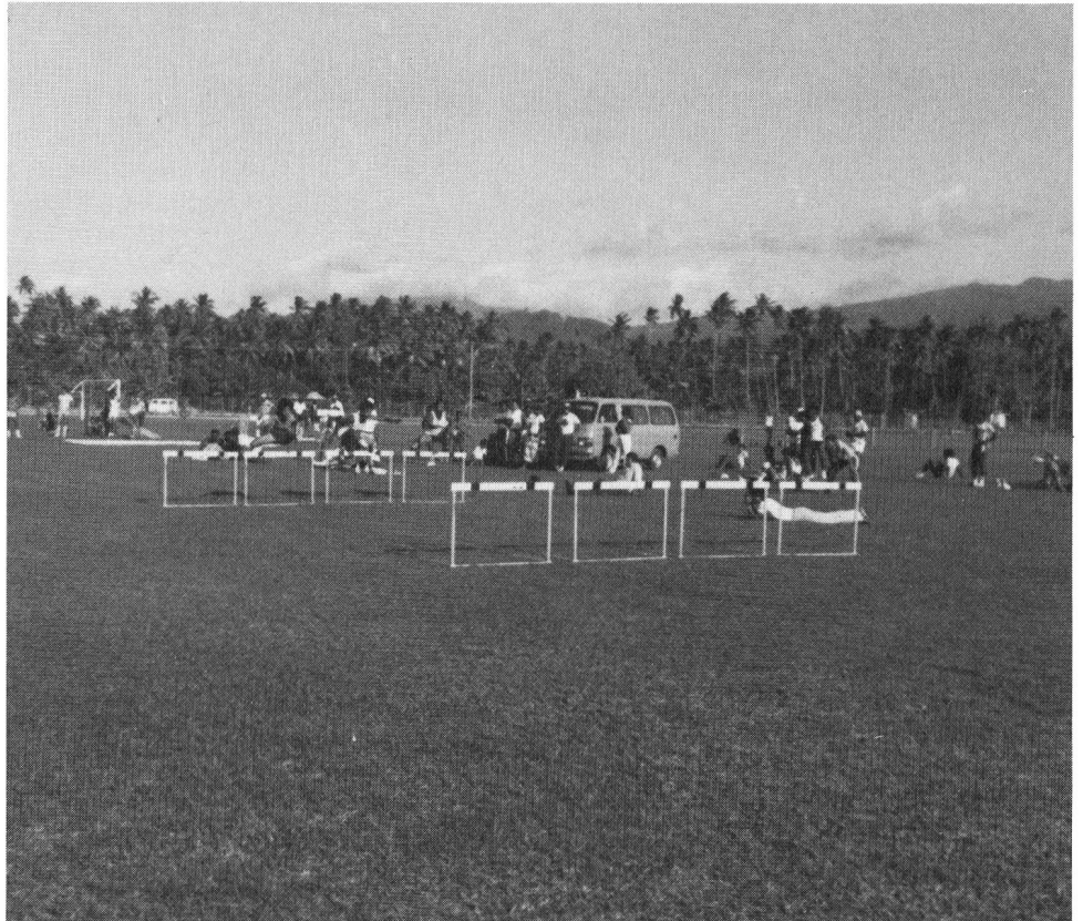
A conferma che la natura è il più bello stadio sportivo

Ormai abituato al fatalismo che regna in questa parte del mondo, tutto ciò mi pare perfettamente logico. Un momento però, ma dov'è l'altra pista? Intorno a me vedo solo palmeti e prati sconnessi, disseminati di sassi coralli-