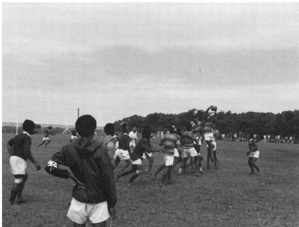
Lo sport nazionale nelle isole Fiji: il Rugby

Una lezione dal terzo mondo per me, atleta frutto della civiltà del benessere, dello sport nel quale sembra scomparire a poco a poco la parola «gioia»... In quei giorni d'agosto, l'attività sportiva era però in fermento. I pochi giornali