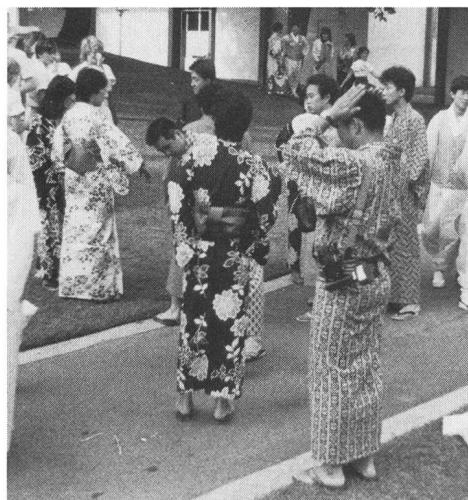
Nota esotica dal Giappone