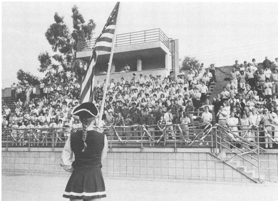
Cerimonia d'apertura del Campo olimpico giovanile

lati, hanno giocato e passeggiato nel parco del «Pitzen College» sopperendo le evidenti lacune linguistiche con grandi gesti esplicativi. Dapprima un pò timidi e chiusi in sé stessi, i membri della delegazione svizzera hanno presto finito per abbandonare la loro tradizionale posizione «a riccio», approfittando senza riserve della calda atmosfera dei luoghi. Le amicizie s'intrecciano e s'approfondiscono con lo scorrere dei Giochi, ciò che ha provocato strazianti addii a bordo del Jumbo che riportava in patria i giovani del campo olimpico: un'ultima stretta di mano, un bacetto furtivo, non dimenticare lo scambio degli indirizzi. C'è voluta una turbolenza e l'ordine del capitano di ritornare ai propri posti e riallacciare la cintura di sicurezza, per riportare l'ordine sul velivolo.