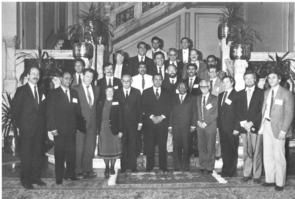
I congressisti attorno al presidente Mubarak.

Durante tutta la durata del congresso, mi sono gustato il raro piacere del «jogging» mattutino in direzione delle piramidi. Nelle prime ore del giorno, il sole non è ancora pesante. Per contro, la circolazione motorizzata è già densa, ma, poiché i pochi asinelli che tirano il loro carro riescono a sopravvivere in mezzo al traffico, non c'è ragione che un podista debba desistere. Asini? Si dice che ve ne siano ancora alcune migliaia, fra oltre due milioni di automobili. La città è tentacolare e nessuno sa dire con esattezza se il numero degli abitanti sia più vicino ai dieci milioni o ai venti. Superata la piramide di Gizeh, le strade si perdono nel deserto. È il momento d'invertire la rotta e riaffrontare la città, appena visibile sotto la cappa grigiastra della polvere e dei gas inquinan-