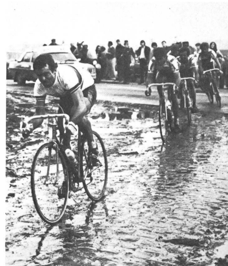
Bernard Hinault vincitore della Parigi-Roubaix del 1981: una corsa... infernale.

Ora è innegabile che taluni aspetti nascondono a questo riguardo dei pericoli troppo facili da enumerare: esasperazione della violenza o dell'aggressività collettiva, irresponsabilità dei tifosi dovuta al «transfer» che si opera, facendo dello sport il cosiddetto « oppio dei