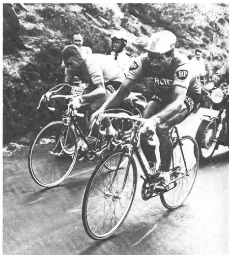
Una delle più belle pagine dell'epopea ciclista: il terribile gomito a gomito di Jacques Anquetil e Raymond Poulidor sul Puy-de-Dôme, al Giro di Francia del 1964.

Al contrario la (molto relativa) vulnerabilità di Poulidor, molto più morale e mentale che propriamente atletica, gli attirava l'incredibile favore del pubblico: quest'ultimo infatti si riconosceva in lui.