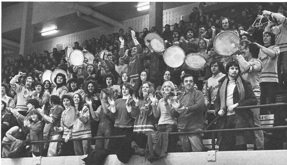
Tifoseria canadese nell'hockey su ghiaccio.

l'impressione di essere vittima di un destino implacabile, segno inconfondibile della tragedia.