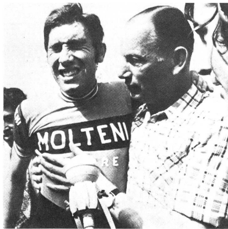
La «maschera» di Eddy Merckx dopo il suo primato dell'ora in Messico nel 1972.

Il mio apprezzamento non si basa su una semplice preferenza verso gli atleti che «si comportano bene» e conservano quindi lo sport al riparo dalla volgarità, intendendo la volgarità come nozione ai limiti dell'estetica e della morale. Vorrei cercare di rendere fondato il mio giudizio, mostrando come, quando teatro e circo si impossessano dello spettacolo sportivo, vi sia confusione e «contagio» fra due ordini diversi. In effetti lo spazio teatrale e quello sportivo, pur presentando l'uno e l'altro finzione o, meglio ancora, gioco rispetto alla vita reale, non si ritrovano, ne si situano allo stesso livello di gioco e allo stesso grado.