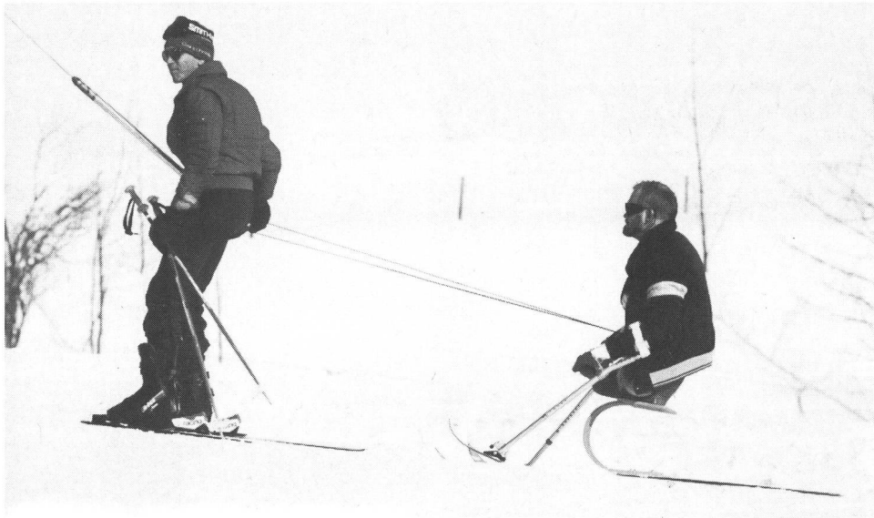
Invalido e non-invalido alla stessa fune.