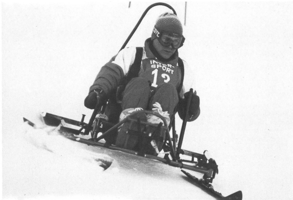
Sci-kart per paraplegici: «High tech».