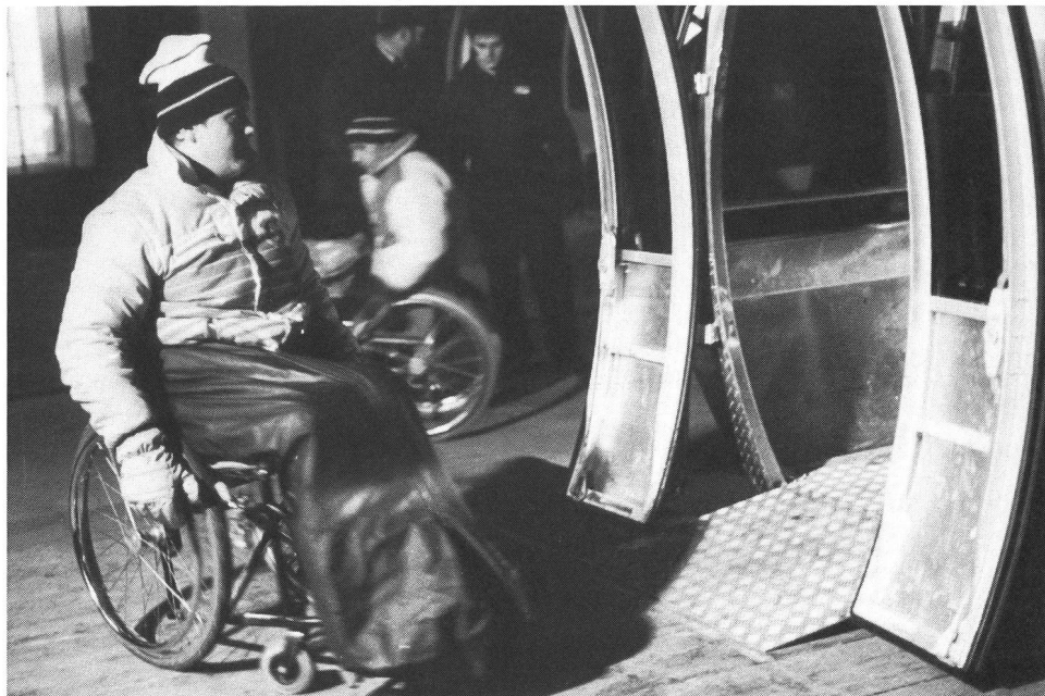
Funivie del Titlis accessibili alle carrozzine.

no a combattere quotidianamente contro ostacoli morali e materiali.