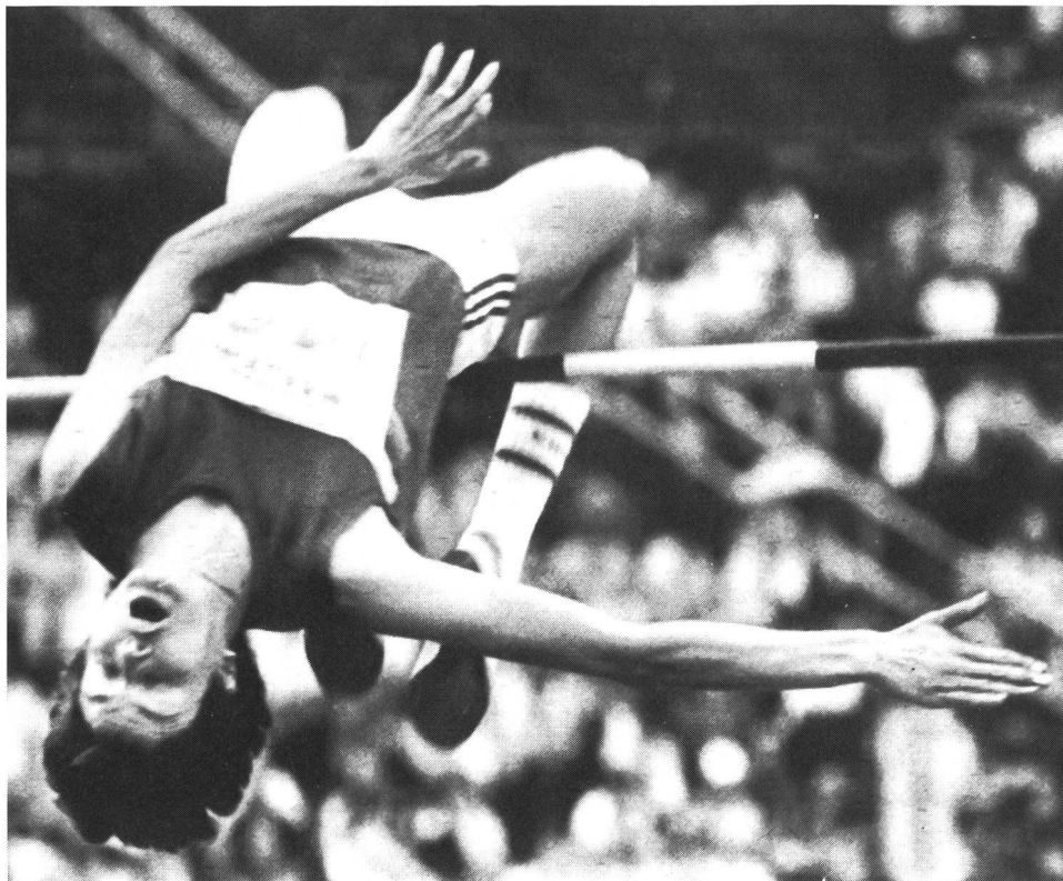
Stefka Kostadinova ha migliorato il record del mondo di salto in alto a Roma portandolo a m 2.09. Nell'88 ha promesso di sfondare il muro dei 2 metri e 10.

Nata in una città industriale in Bulgaria, Plovdiv, la storia della bella Stefka è fatta di una rincorsa al primato fortemente voluta. In un Paese dove le vittorie sportive schiudono le porte ad una