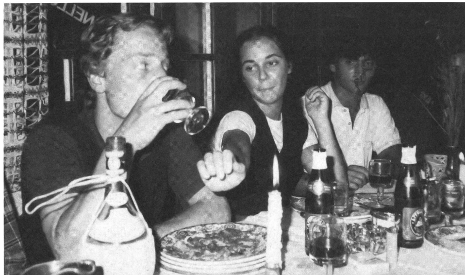
L'oscuro cibo del desiderio ...