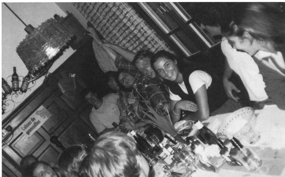
A cena con gli amici, senza complessi.

La posta in gioco è molto alta: il cittadino può mettere in dubbio la credibilità dell'uomo politico. La situazione è assai precaria in alcuni comuni. Le stesse promesse, mai mantenute, si ripetono ad ogni scadenza elettorale. □