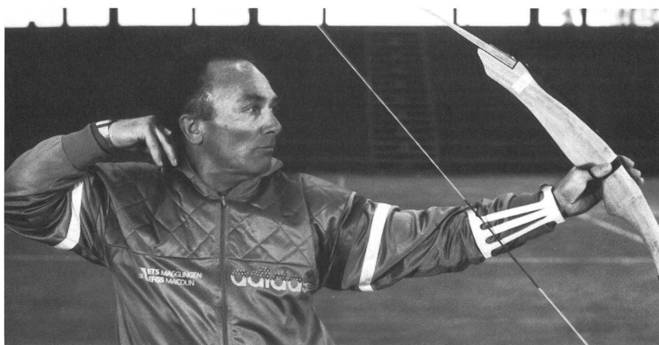
Foto 8: lo sgancio è preceduto da una contrazione della muscolatura della schiena e da un rilassamento della muscolatura della mano e delle dita.