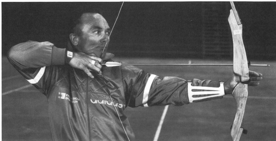
Foto 7: la trazione nel prolungamento della freccia, gomito alla stessa altezza.

Quando diventerà il tiro con l'arco il tuo sport?