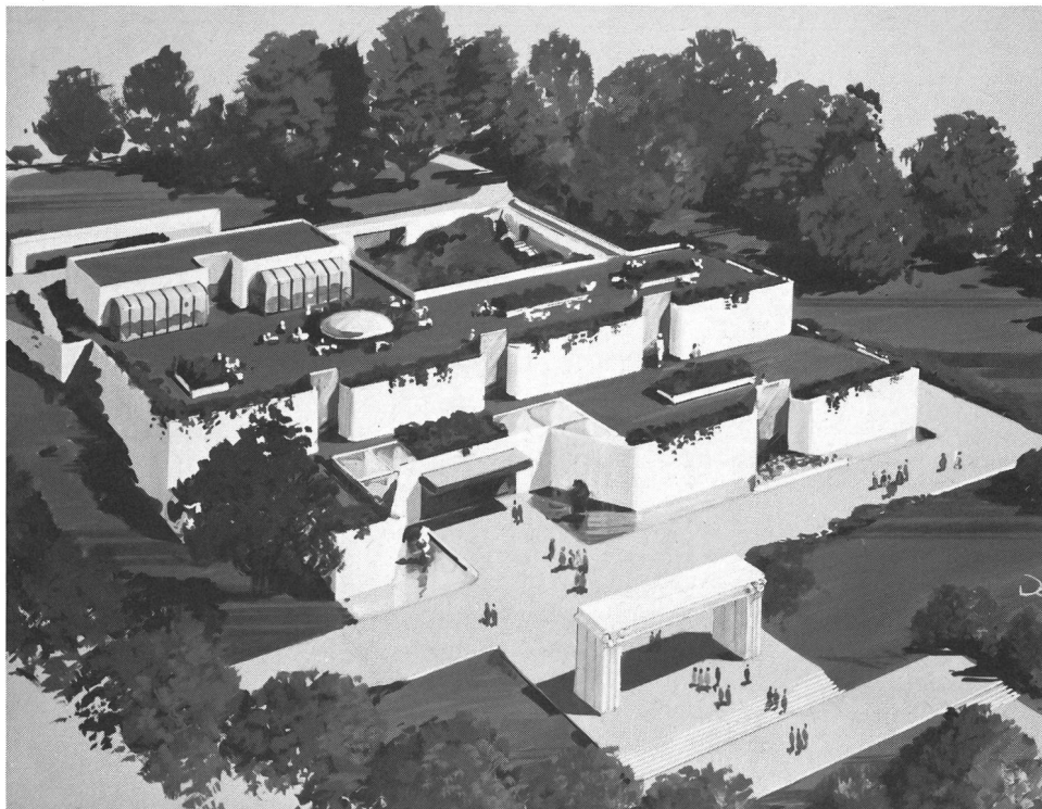
Modello del futuro Museo olimpico a Ouchy.

audiovisivi) possiamo dire che forma un autentico centro di studio olimpico. Centro a disposizione del pubblico anche se, per ragioni di struttura, non siamo ancora in grado di offrire un servizio di prestito a domicilio. Un servizio di fotocopie permette di sopperire parzialmente a questa situazione».