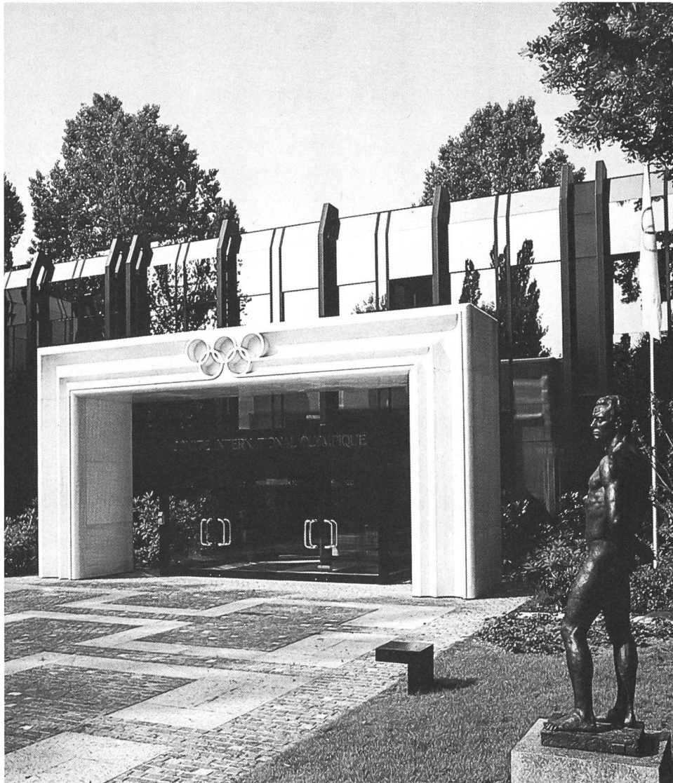
Casa olimpica a Vidy, sede del CIO, con una statua come si ritroveranno nel Parco olimpico di Ouchy.