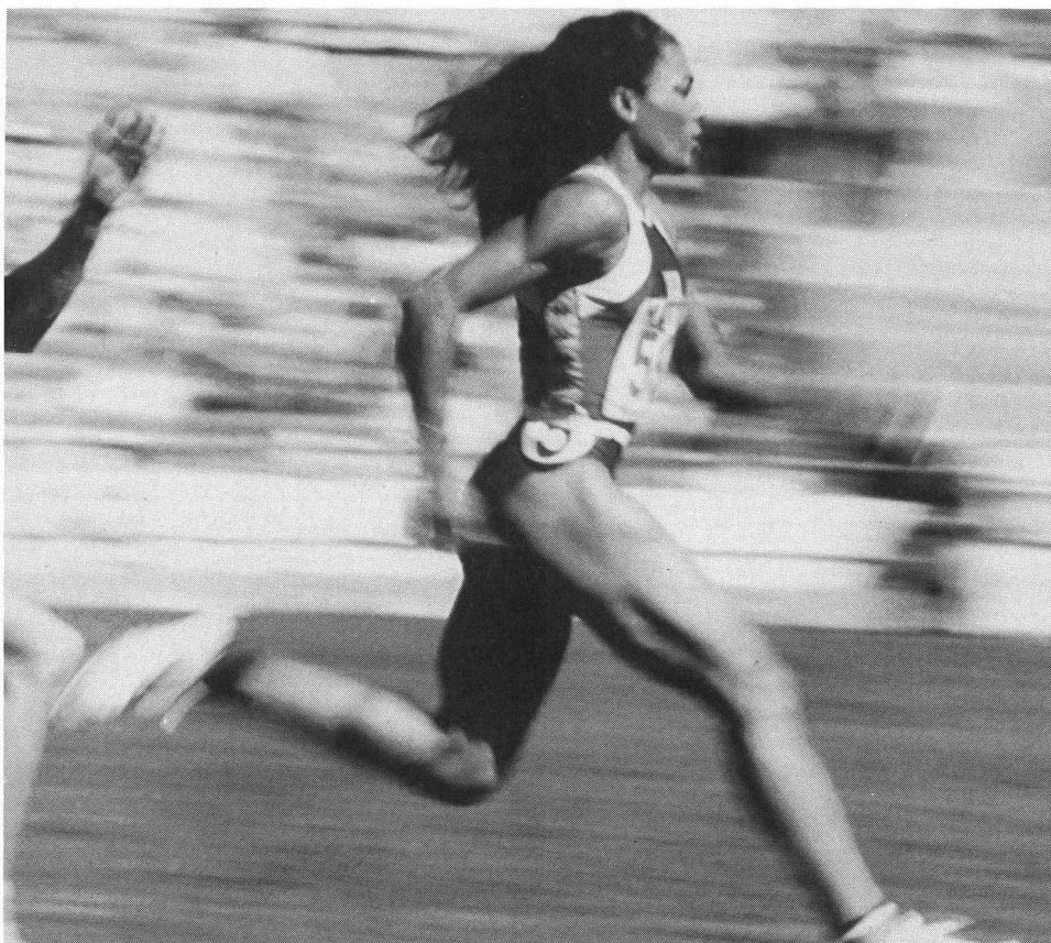
Due primati mondiali stabiliti nel giro di un'ora. La Griffith può essere a ragione ribattezzata la donna «bionica».