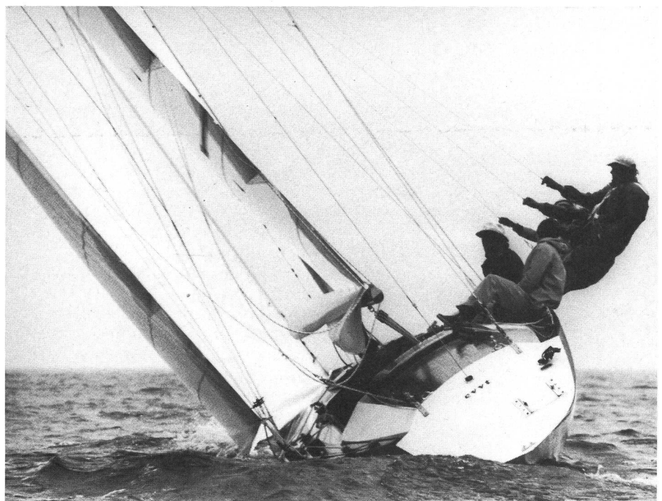
L'equipaggio di grosse imbarcazioni ha cominciato con quelle piccole.

Lo sport della vela è divenuto popolare grazie soprattutto alla concezione di imbarcazioni più leggere e allo sviluppo della disciplina del surf. Attualmente si può affermare che una stagione di competizione su certi tipi di vela costa meno, a parità di livello, rispetto a una stagione di sci («compreso acquisto del materiale»). Lo sport della vela è molto popolare in Francia; in Svizzera, coloro che praticano questa disciplina sono in continuo aumento.