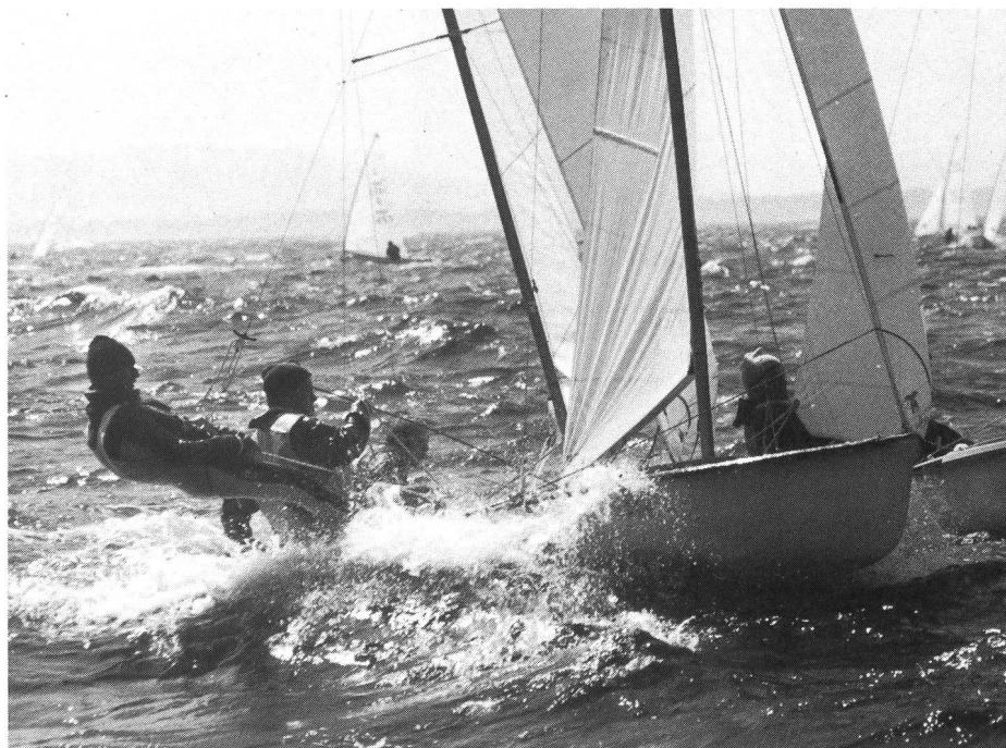
Le condizioni sempre in cambiamento obbligano il navigatore ad adattarsi.

Speriamo che questo scritto contribuisca ad avvicinare il giovane a questa nuova attività. (red.)