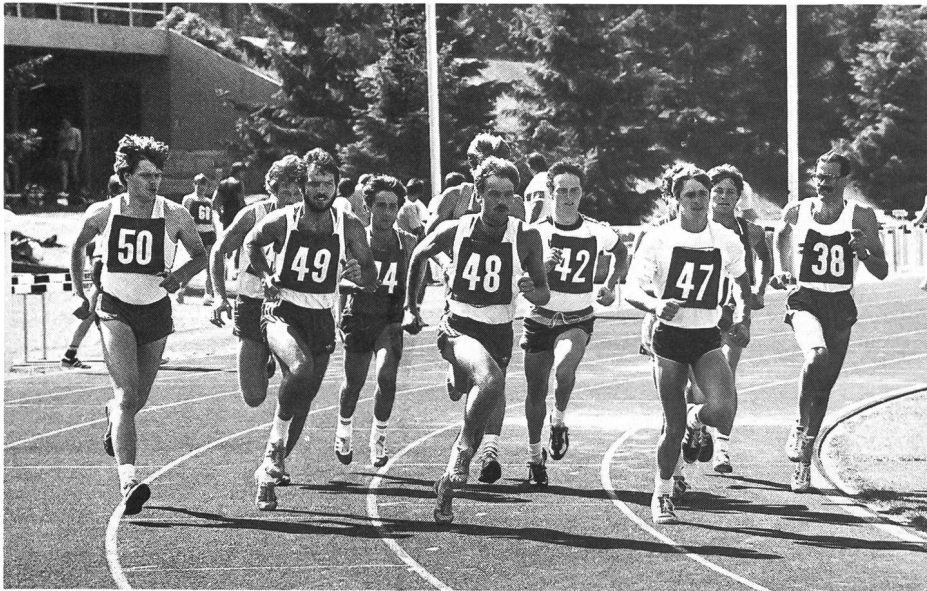
Pieni di speranza alla partenza: esami d'ammissione al ciclo di studi della SFSM.

gere già nel quinto decennio di vita in tale misura da impedire l'insegnamento ottimale di alcune discipline sportive.