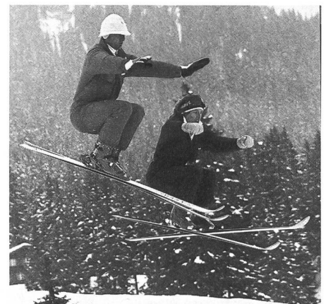
I maestri di sci incontrano spesso problemi con l'avanzare dell'età.

Gli insegnanti di sport, con il passare degli anni, sono confrontati con un mutamento di significato del loro ruolo, il quale necessita di regola un nuovo orientamento. A questo proposito ha avuto luogo lo scorso anno nella Repubblica federale tedesca un corso