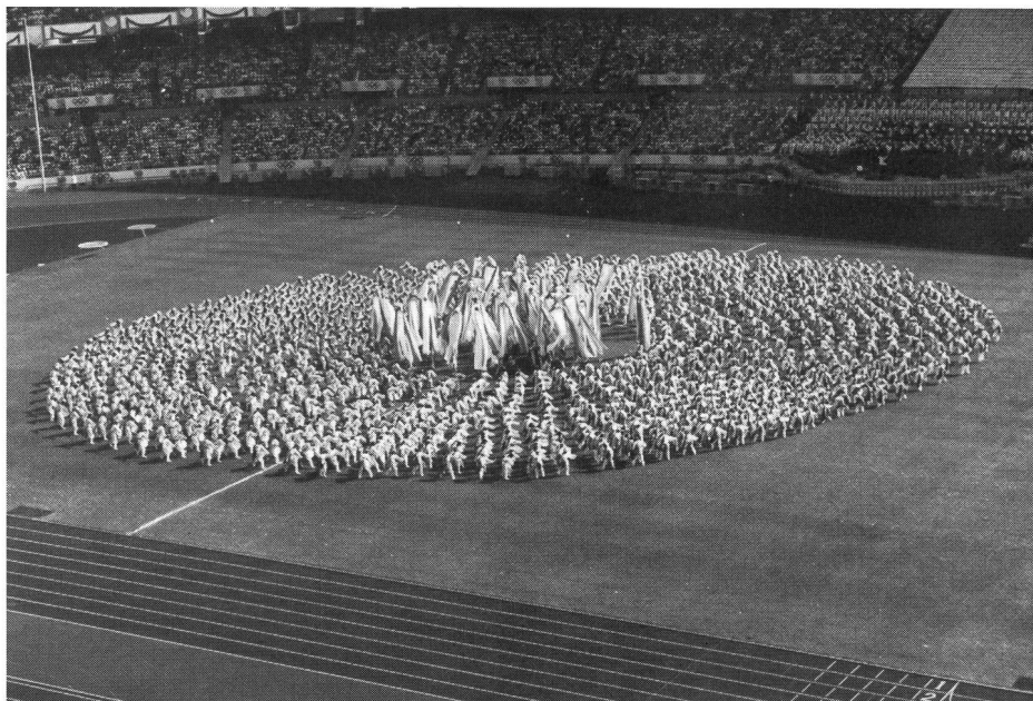
Le grandi manifestazioni sportive dipendono ormai dai media.

Un primo cambiamento è dato dall'aumento delle aspettative riposte nella vita. Se, nel 1975, il fascio d'età superiore ai 60 anni rappresentava 1/6 della popolazione totale, nel 1985 la percentuale si è alzata fino a 1/5 e nel 2000 raggiungerà 1/3 o 1/4. Questo provoca un mutamento della piramide d'età della popolazione. Se nel 1900, per ogni Svizzero sopra ai 65 anni si contavano circa 20 giovani sotto ai 15 anni, ora le due fasce d'età si trovano in un rapporto di 1:1 e nel 2000 si giungerà all'inusuale inversione di un giovane su due anziani sopra i 65 anni. Le congruenze per l'organizzazione, la struttura dello sport sono assai importanti: nel futuro avremo sempre un numero maggiore di anziani alla ricerca di nuove offerte per praticare sport. Mentre lo sport giovanile sarà sempre praticato con la stessa intensità, lo sport per la «terza età» avrà un ruolo dominante dato dalla sua superiorità numerica.