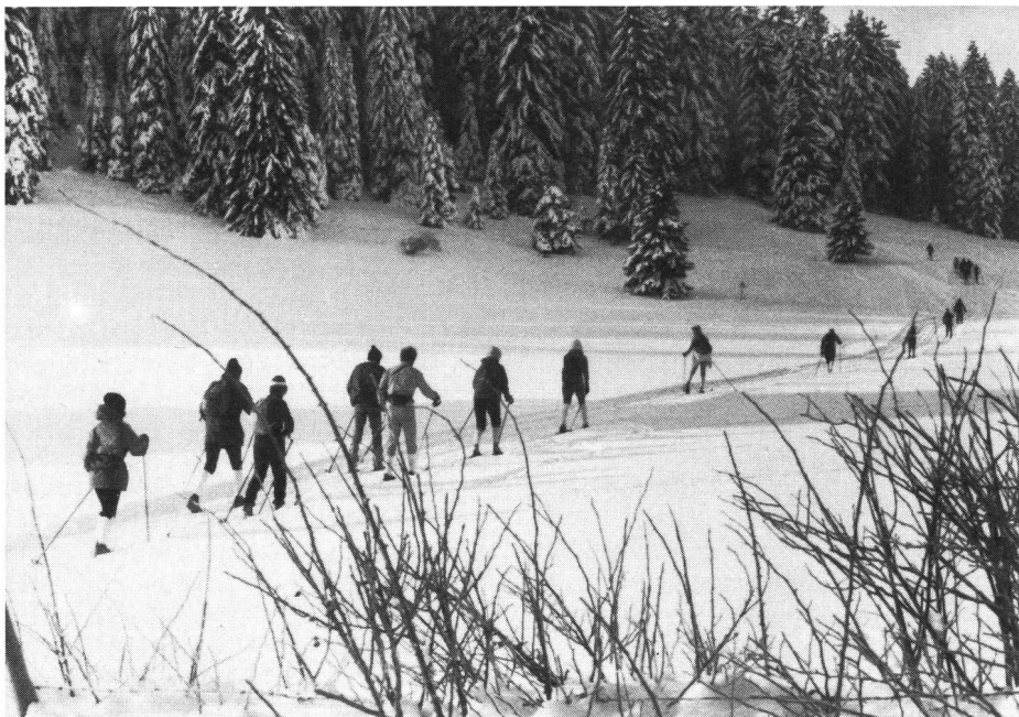
Sport nel rispetto della natura.

vo. In chiara diminuzione sono le entrate pubblicitarie delle manifestazioni di atletica leggera dopo l'affare Johnson. L'integrità etico-morale dello sport è molto importante per i vari prodotti e per le imprese. Il collegamento di un prodotto o di un'azienda con un record «non pulito» può avere conseguenze negative. Probabilmente anche gli sponsor adottano un sistema di regolazione che ci fa ben sperare per la sopravvivenza dello sport di prestazione.