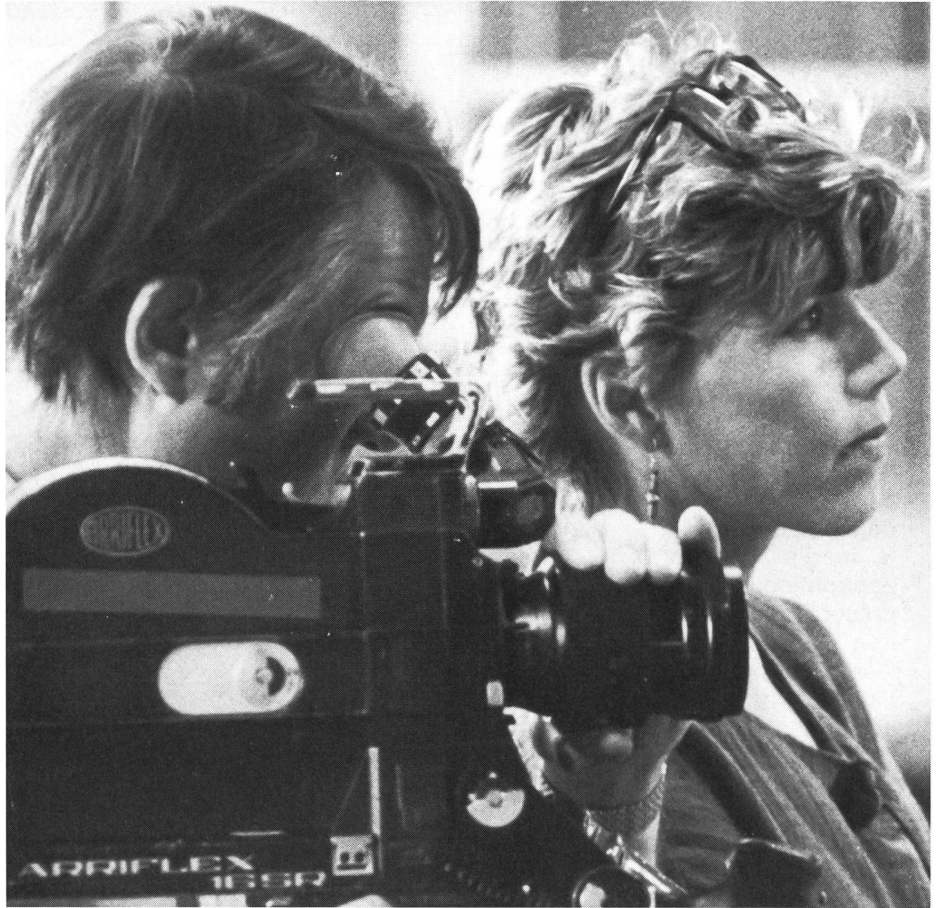
La responsabilità dei media nello sport, anche nel 2000.