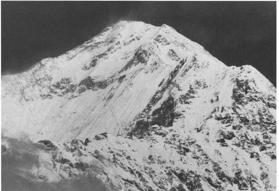
Il mal di montagna può colpire anche persone allenate.

Gli anziani sono gli individui maggiormente a rischio, ma anche i bambini da 1 a 2 anni, che sono molto attivi, hanno probabilità di sviluppare tale sintomatologia. Il consiglio che si può dare è quello di evitare, al di sopra dei 2700 metri, salite rapide di quota di più di 300 metri. Altro accorgimento è quello di «sciare in alto e dormire in basso». Una notte passata a quote intorno ai 2000-2500 metri renderà più tollerabile l'ascesa su quote oltre i 3000 durante il giorno. Un'attenzione particolare va riservata agli spostamenti in aereo, che prevedono passaggi da città situate a livello del mare a località di alta quota. È il classico circuito del Sud America che prevede ad esempio, un volo da Rio de Janeiro, sul mare, ai 4400 metri di La Paz in Bolivia. Respirare ossigeno può aiutare nella fase acuta dei disturbi, ma se non si scende di quota di fronte a sintomi di una certa gravità si può rischiare la vita.