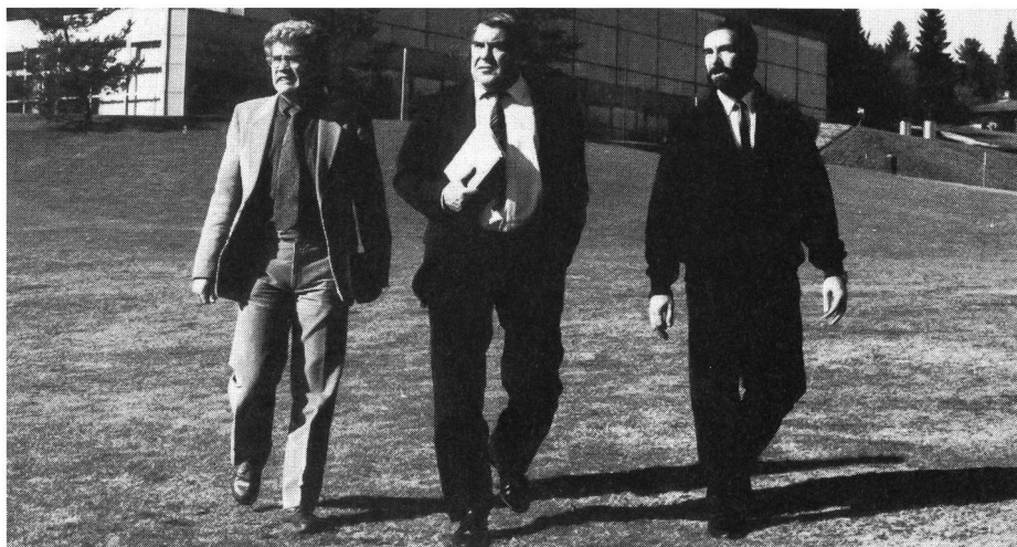
Al centro: il direttore dell'INSEP di Parigi, Claude Bouquin.

La Scuola federale dello sport di Macolin e l'Institut national du sport et de l'éducation physique, simili e diversi: simili per il loro compito di sostegno e di promozione dello sport, diversi per i loro mezzi e certi obiettivi. Una possibilità ora di un mutuo arricchimento al servizio del buon sport.