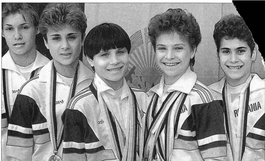
Quasi impossibile enumerare quanti successi hanno conquistato queste ragazze: grazie a un allenamento e una disciplina assidui, bisogna riconoscerlo, ma anche grazie alla loro scioltezza infantile... più giovani della loro età ufficiale.