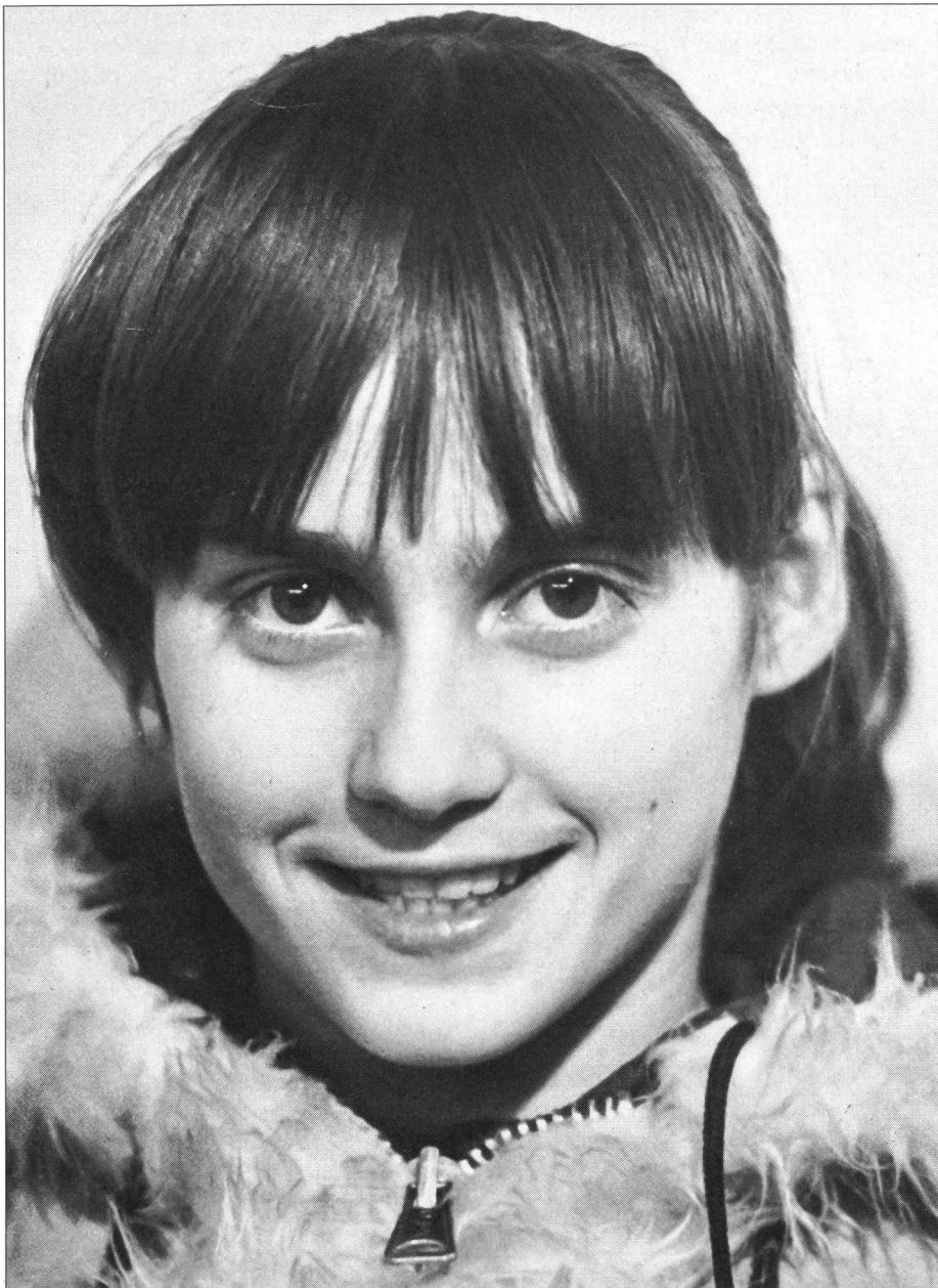
Nadia Comaneci all'età di 14 anni.

tecnica. Quando ci trovavamo all'estero e, ad esempio in un hôtel, eravamo confrontati con un apparecchio sconosciuto senza sapere come utilizzarlo, tutti chiedevamo soccorso alla campionessa: «Nadia, come funziona?» E lei, senza esitare, girava il giusto bottone ed accendeva o spegneva l'apparecchio sconosciuto.