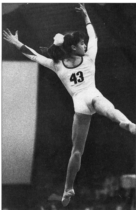
Nadia Comaneci a tredici anni: la sua grazia giovanile è reale. Era nel 1975.

Vi sono stati dunque dei drammi, in Romania come in Russia. È capitato che ginnasti, spinti a prendere tutti i rischi, siano morti tragicamente o siano stati condannati alla sedia a rotelle.