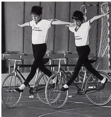
In copertina: ciclopalla e ciclismo artistico sono discipline «Cenerentole» di questa particolare area sportiva. Eppure riescono ad avere un certo successo e un pubblico affascinato e partecipe. L'articolo in «Teoria e pratica» svela alcuni particolari, per lo più sconosciuti ai nostri lettori.