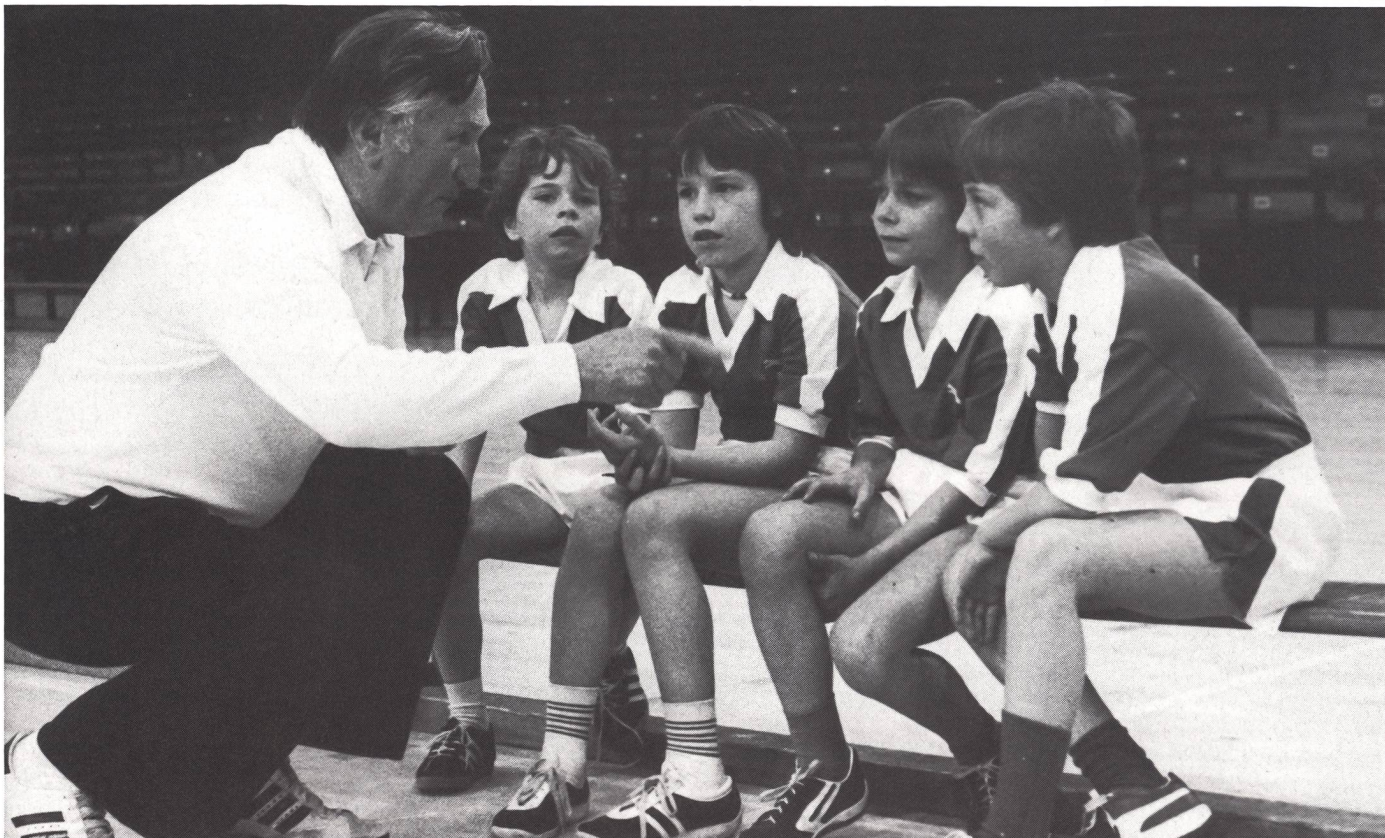
L'allenatore deve essere fidato, paziente, servizievole, semplice nei modi.

rò in parecchi casi esiste solo sulla carta: nella pratica di tutti i giorni non viene preso in considerazione o sviluppato abbastanza.