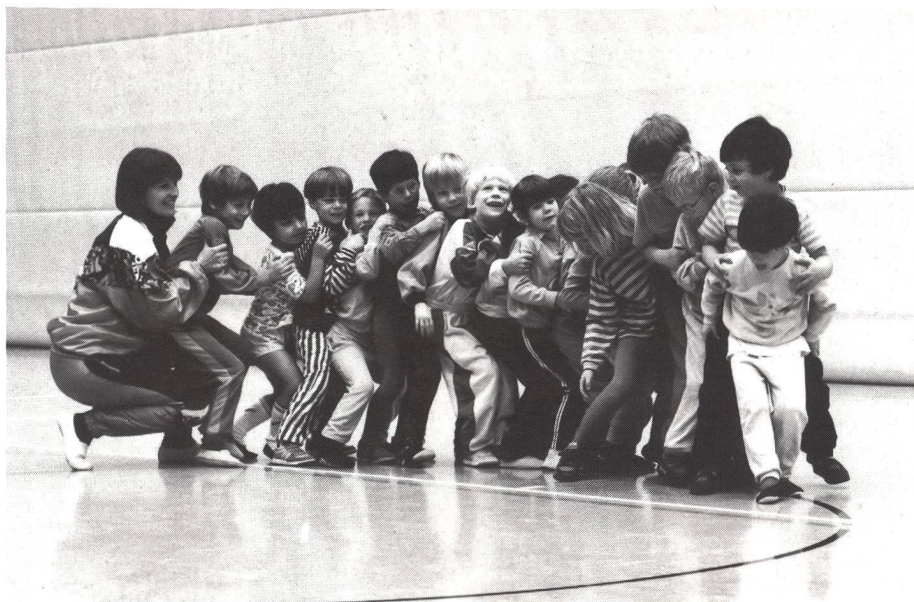
L'insegnante è anche compagno di giochi...

Lentamente ma con successo si stanno inserendo i docenti «speciali» per l'educazione fisica in tutte le sedi delle scuole elementari, e questo non per