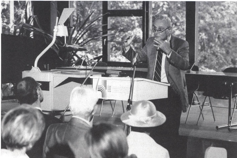
Tramite le scienze, collocare meglio lo sport.

dello sport, con la presentazione di progetti interessanti, deve pure poterne approfittare. Come già si sa, il credito della Commissione federale dello sport destinato alla ricerca sarà aumentato di conseguenza . Spero che riusciremo così a dare allo sport e alle scienze dello sport una migliore collocazione.