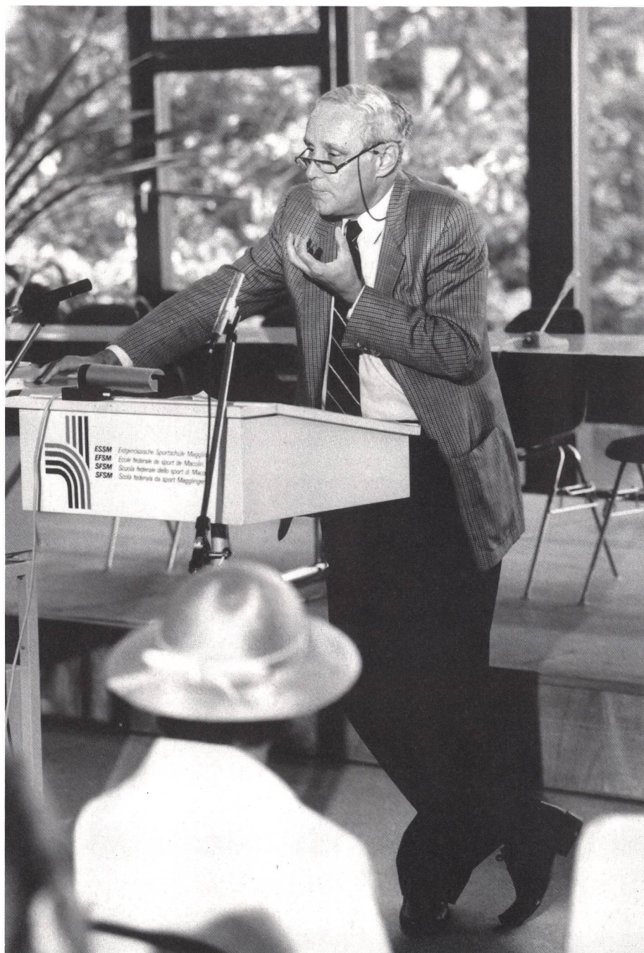
Lo sport assume un significato esistenziale.

Il sistema scolastico svizzero ha tenuto conto delle loro considerazioni e i cantoni hanno dato una crescente importanza all'insegnamento dello sport nelle scuole. Lo sport è la sola materia scolastica sottoposta al diritto federale, il quale determina il numero minimo di ore d'insegnamento