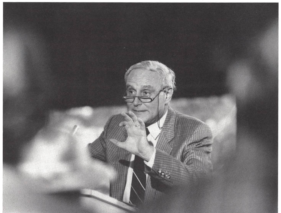
La società sportiva ha sempre più compiti d'interesse collettivo.

re umano dipende dalle sue capacità – e voglio qui ricordare a proposito di sport, questo straordinario fenomeno sociale. Il tema è prominente, ma non si può trascurare l'aspetto finanziario. Impegniamoci, dunque, per esempio, per un aumento dei sussidi destinati alle federazioni sportive per la formazione dei monitori. Spero che il Parlamento mi segua ... Poiché ogni franco investito per una buona formazione di monitor rende tra sei e dieci volte l'investimento iniziale. Comunque, la qualità di questo genere di formazione dipende soprattutto da chi è alla guida dello sport svizzero. Di conseguenza ringrazio per il vostro impegno, di cui non bisognerebbe sottovalutare l'importanza.