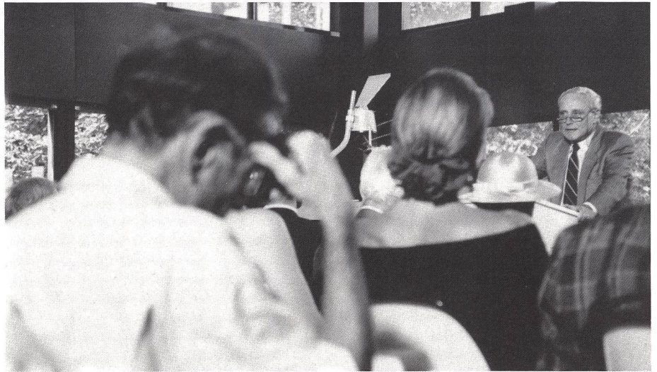
Per il futuro dello sport: coraggio e responsabilità.

Vecchi atteggiamenti presuntuosi, se ancora esistono, devono sparire. Ma non devono in nessun caso lasciar posto a complessi d'inferiorità che in nessun modo né la Svizzera né la sua popolazione meritano. Attacchiamo-