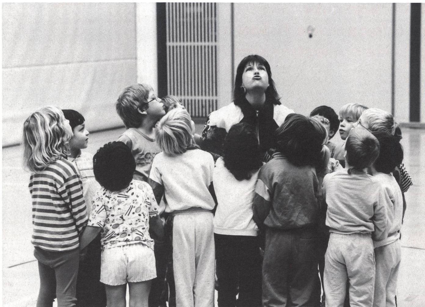
L'insegnamento dell'educazione fisica è fondamentale per lo sviluppo psicofisico dell'allievo.

materiali che affittiamo, sulle proposte a venire, ma abbiamo bisogno di un costante contatto coi soci. Questo può avvenire in modi diversi, anche semplicemente con una critica costruttiva, con una richiesta di informazioni, con la partecipazione alle riunioni mensili di Comitato che sono aperte a tutti e che si svolgono nella sede sociale, messa gentilmente a disposizione dal comune di Pregassona.