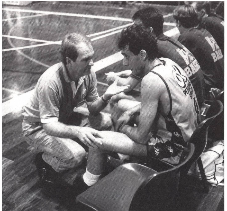
Il dialogo favorisce la fiducia reciproca.

Commento: questi esercizi hanno il vantaggio di migliorare le conoscenze degli altri membri della squadra. Per