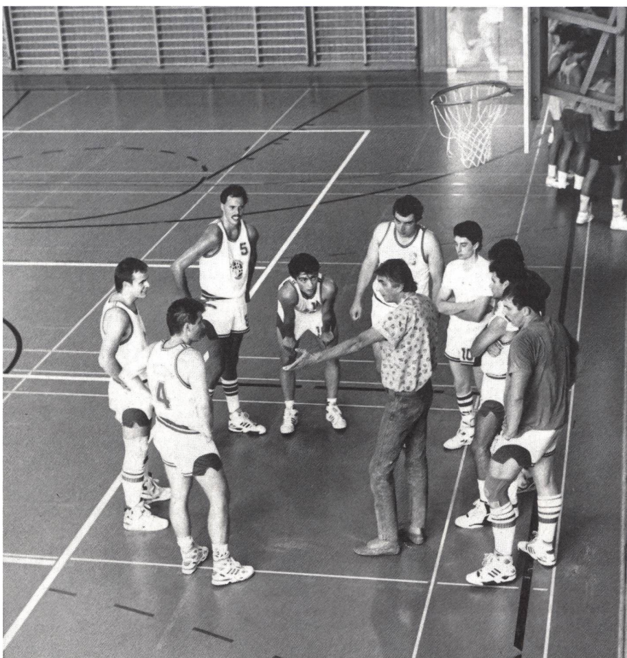
L'allenatore deve essere sempre credibile.