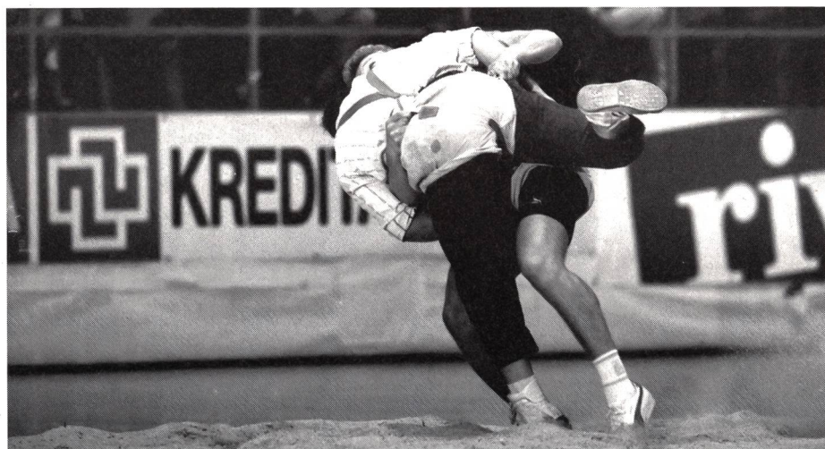
Anche nella lotta svizzera i talenti (?) non mancano!!

di Ellade Corazza