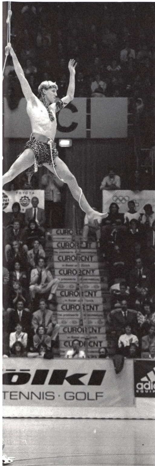
vedere molto bene la sua immagine ... ti i presenti!

Le prove iniziano ed è davvero interessante testare l'adattabilità degli atleti! Senza fare nomi, posso dire che molte volte ho pensato ... datti all'ippica! ... ma il detto di De Coubertin «L'importante non è vincere ma partecipare!» è in questo caso azzeccatissimo!