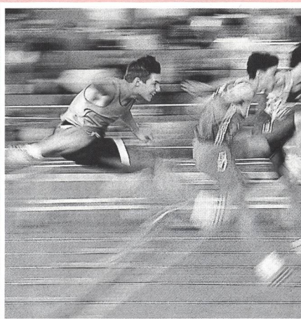
In copertina: movimento e dinamica nell'atletica leggera - due concetti non solo legati all'allenamento e alla competizione, bensì anche a struttura e contenuti dell'atletica infantile e giovanile. Se ne occupa, da pag. 2, Rolf Weber, capodisciplina G+S presso la Scuola di Macolin.