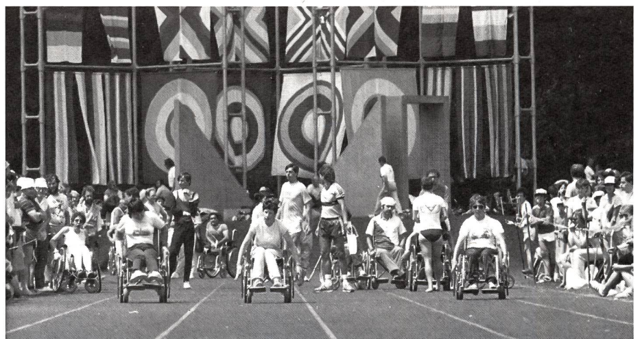
Anche i giovani invalidi hanno diritto a G+S.

Se un monitore segue un corso di perfezionamento in uno degli orientamenti della sua disciplina, soddisfa l'obbligo di seguire un CP per la disciplina in generale.