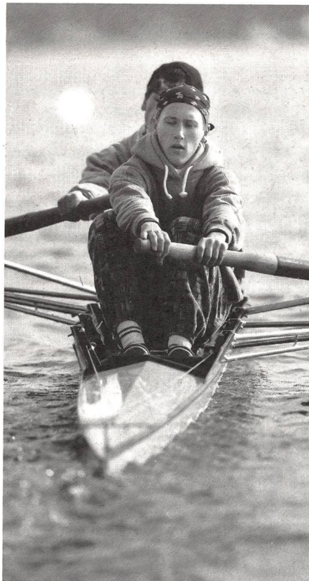
Prima dell'imbarcazione di punta ...

gazzi per un totale di 74 000 lezioni. Oggi, questa cifra, è praticamente raddoppiata: 122 000 unità d'insegnamento, 700 ragazze e 3000 ragazzi. Uno sviluppo fulminante, che però non può incrementarsi per logici problemi di materiale.