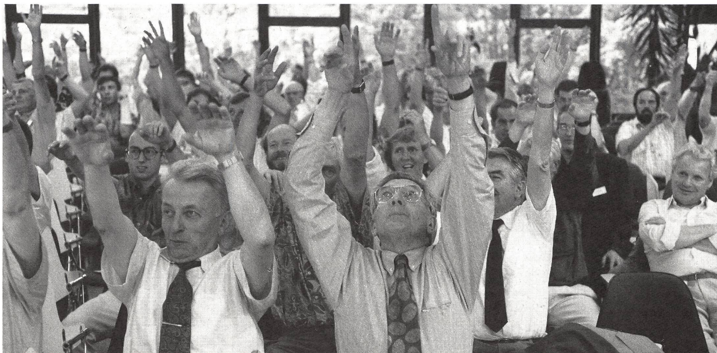
I partecipanti inneggiano ad uno sport d'alto livello più umano.