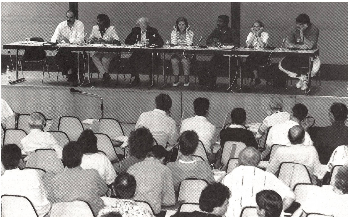
«Non siamo né vittime né eroi!» Così si sono espressi gli atleti durante la discussione finale.

essere dunque «curata» con una terapia di tipo farmacologico. La tesi assume una valenza del tutto particolare, in quanto è stata sottoscritta dalle istituzioni competenti di Svizzera, Francia e Germania, e getta le basi per una coordinazione europea a livello di «diritto alla salute» dell'atleta.