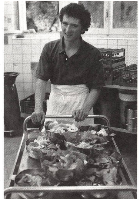
Sopra. Un campione olimpico in cucina: Hippolyt Kempf, campione olimpico nella combinata nordica, ha svolto recentemente il suo corso di ripetizione presso la cucina della SFSM.

Il premio Pittet del CIO ad Aldo Sartori è anche un riconoscimento di quanto il Ticino ha realizzato nel campo della promozione sportiva in tutti i settori: da quello popolare a quello agonistico d'alto livello. (ADA)