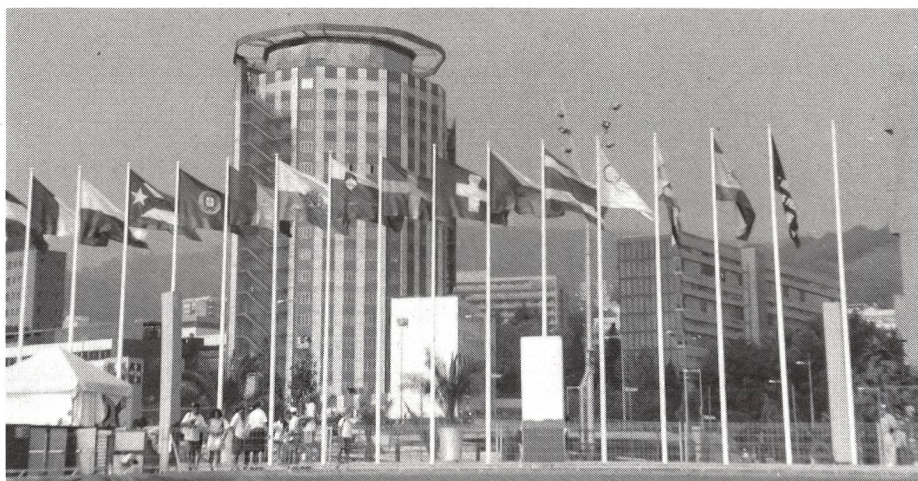
... per 172 nazioni.

Questo discorso, però, non vale per gli atleti, per i quali la prima Patria rimane sempre la nazione per la quale partecipano ai Giochi. Questo lo si è capito sempre in occasione delle cerimonie di premiazione. Infatti, la gioia e l'emozione per il risultato ottenuto raggiungeva i momenti di massima espressione durante la celebrazione dell'inno olimpico. Così, non solamente la prestazione raggiunta ma anche il patriottismo espresso è una giustificazione per mirare sempre al successo. La Neue Zürcher Zeitung ha scritto in occasione dei Giochi olimpici che «la Svizzera manca di buoni sportivi e agli sportivi svizzeri manca un pò di spirito di nazionalismo». ■