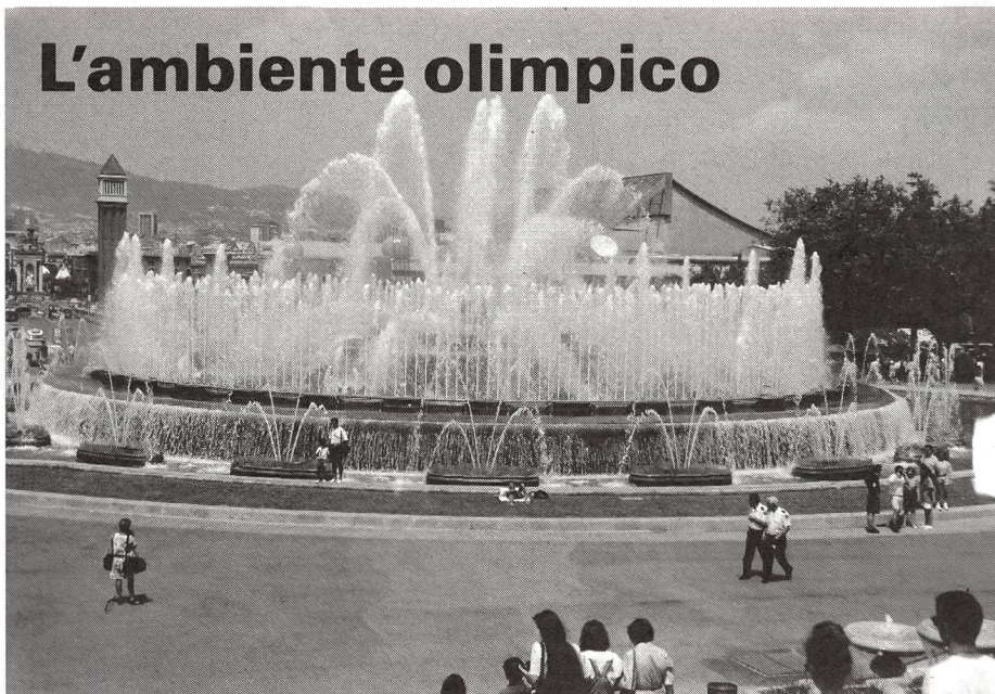
Mille fontane ...

I Jocs de la XXVa Olimpiada sono stati un avvenimento memorabile. Le prime impressioni raccolte sul posto non possono essere paragonate per intensità all'immagine che i massmedia hanno dato di questo avvenimento attraverso articoli, servizi radiofonici e televisivi. Infatti, note critiche ve ne sono state in ogni occasione, e più particolarmente sulle singole prestazioni, sull'ambiente e le condizioni di gara.