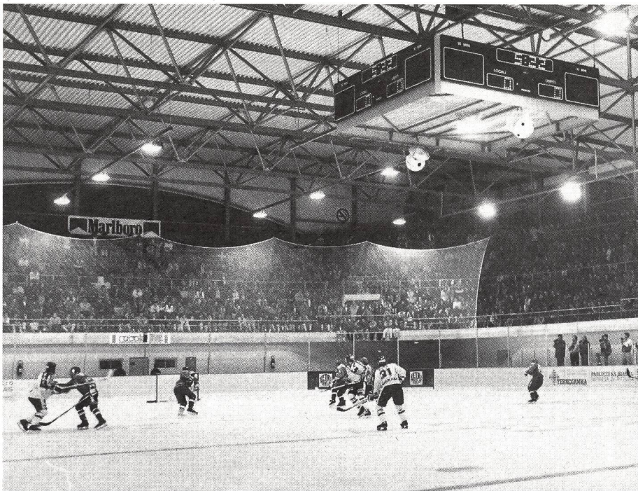
La nuova pista di Biasca nel giorno dell'inaugurazione.