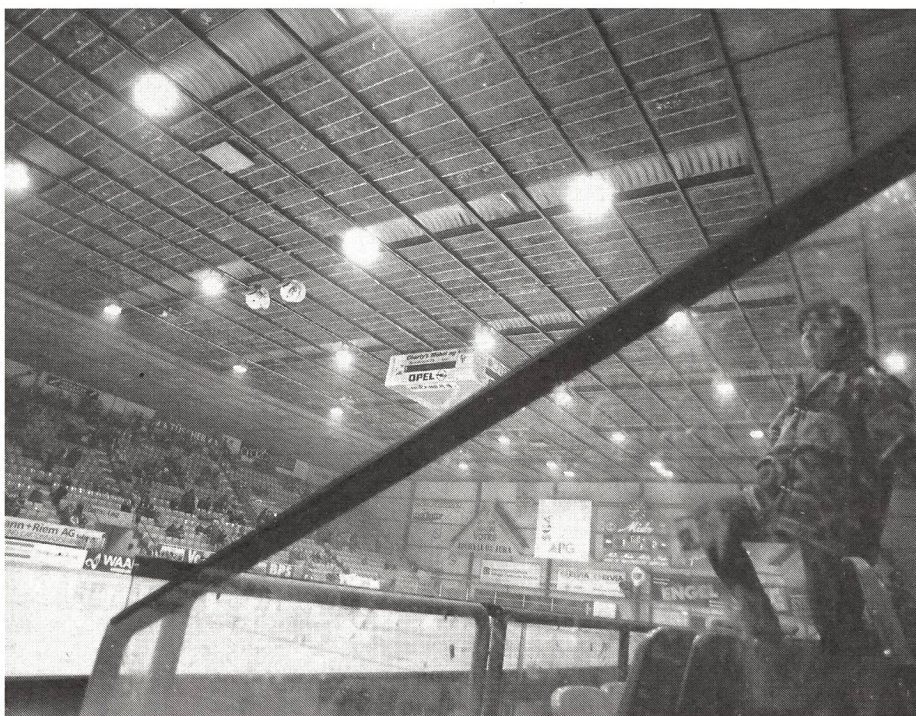
La Lega ha denunciato la precarietà della pista di Bienne.

Da un punto di vista giuridico, ci muoviamo nel campo dell' obbligo di mantenimento da parte del proprietario nei confronti degli oggetti, e quindi anche degli impianti e degli edifici. Il proprietario ha inoltre lo stesso obbligo verso la popolazione ed è quindi chiaro che occorre favorire un contatto continuo tra i proprietari degli stadi e le direzioni dei club. Quest'ultime hanno inoltre il dovere di comunicare per iscritto ai relativi proprietari eventuali difetti, danni o lacune che presentano un certo grado di rischio.