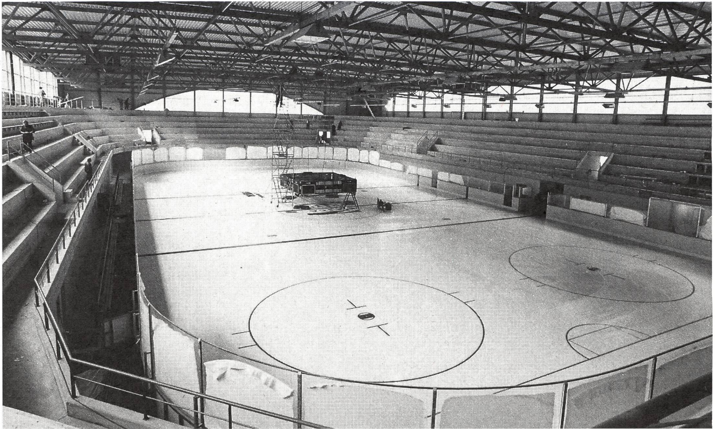
La pista di Biasca è stata costruita nel rispetto delle regole stabilite dalla LSHG.