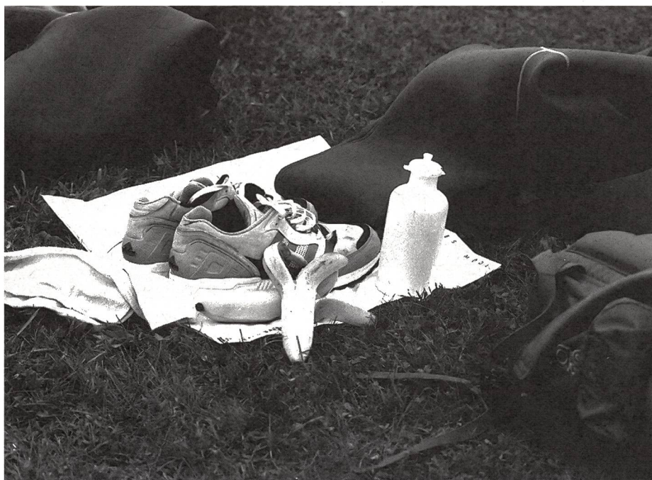
Triathlon, disciplina polivalente anche nel materiale !

Dopo il nuoto si sale in bicicletta; è il momento di alimentare il nostro corpo e di prepararlo alla distanza da coprire. Una partenza leggera in crescendo è consigliabile per evitare inutili crampi.