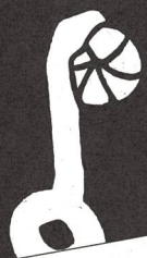
foto e testo di Hugo Lörtscher traduzione ed adattamento di Rossella Cotti