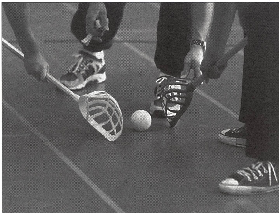
Rimessa in gioco: pallina fra i bastoni con cestino rovesciato.