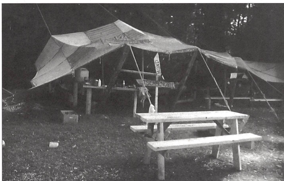
La cucina, necessaria anche nel bosco.

L'autore ha riunito in questo articolo alcune riflessioni e idee di possibili attività per corsi e campi che si svolgono nel bosco. Pone l'accento sul comportamento responsabile e rispettoso da adottare rispetto ad un ambiente sensibile quale il bosco.