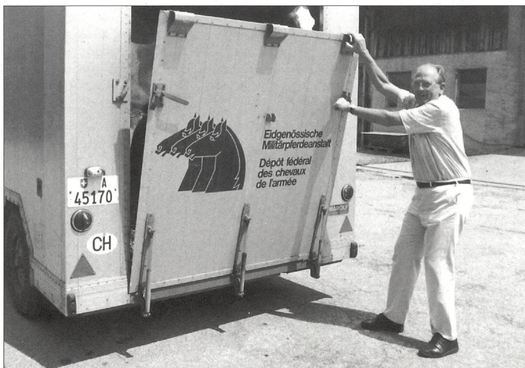
Animali, agricoltura e sport: una vita!

Grazie per aver dedicato una vita allo sport e ai giovani. ■