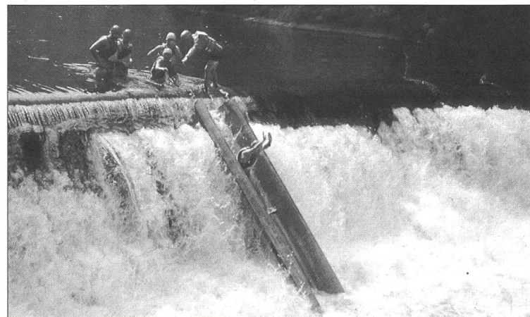
Lo spassoso passaggio sullo scivolo sul Doubs.