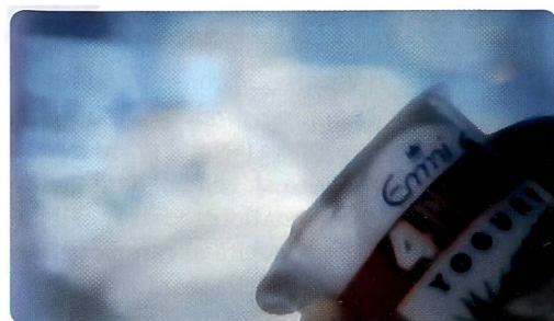
Spot televisivo: Emmi Svizzera SA, Lucerna

municazioni acquista un biglietto d'ingresso su tutti i giornali svizzeri. Anche il PR per i prodotti non è nient'altro che pubblicità. Tutti gli articoli che appaiono su riviste e giornali sotto il titolo di «novità» o «attualità» possono essere considerati come pubblicità a buon mercato. Se in un film appare una marca, non si tratta di caso fortuito ma di «product placement» acquistato per denaro sonante.