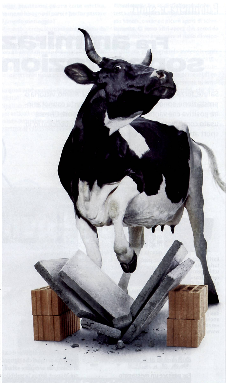
Ritaglio da una pubblicità della Federazione svizzera dei produttori di latte

Ci sono diversi meccanismi di regolazione politico educativa che impediscono pubblicità contraria all'estetica, alla morale e ai costumi o dannosa per la salute pubblica (tabacco, alcool, professioni). Determinate limitazioni sono sensate, altre sembrano superate nel mercato