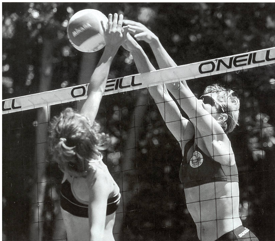
È importante allenarsi come si vuole giocare e giocare come ci si allena.