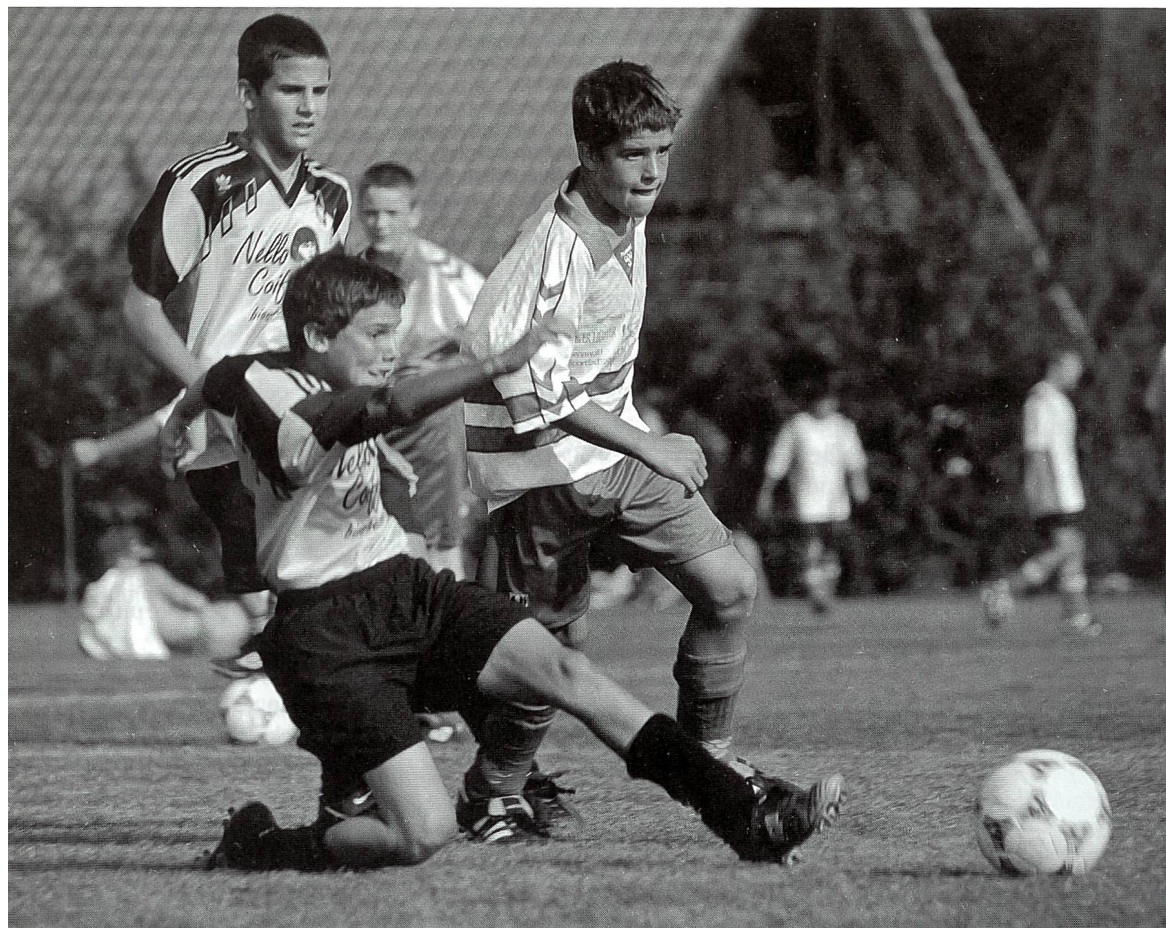
In ultima analisi sono i giocatori stessi a decidersi per una tattica.

Perciò, con il crescere dell'età occorre porre accenti tattici adeguati: nella prima età scolare (da 6 a 10 anni) volutamente ancora non parliamo di formazione tattica. Qui in primo piano vi debbono essere l'esperienza ludica, gli stimoli coordinativi e cognitivi. Nella seconda età scolare (da 10 a 14 anni) al centro troviamo, chiaramente, la formazione tecnica. Però la tecnica deve essere acquisita, stabilizzata ed utilizzata nelle corrispondenti situazioni tattiche di base. Nel settore giovanile occorre che la maggiore valenza venga attribuita alla formazione tattica, intesa come formazione globale al gioco.