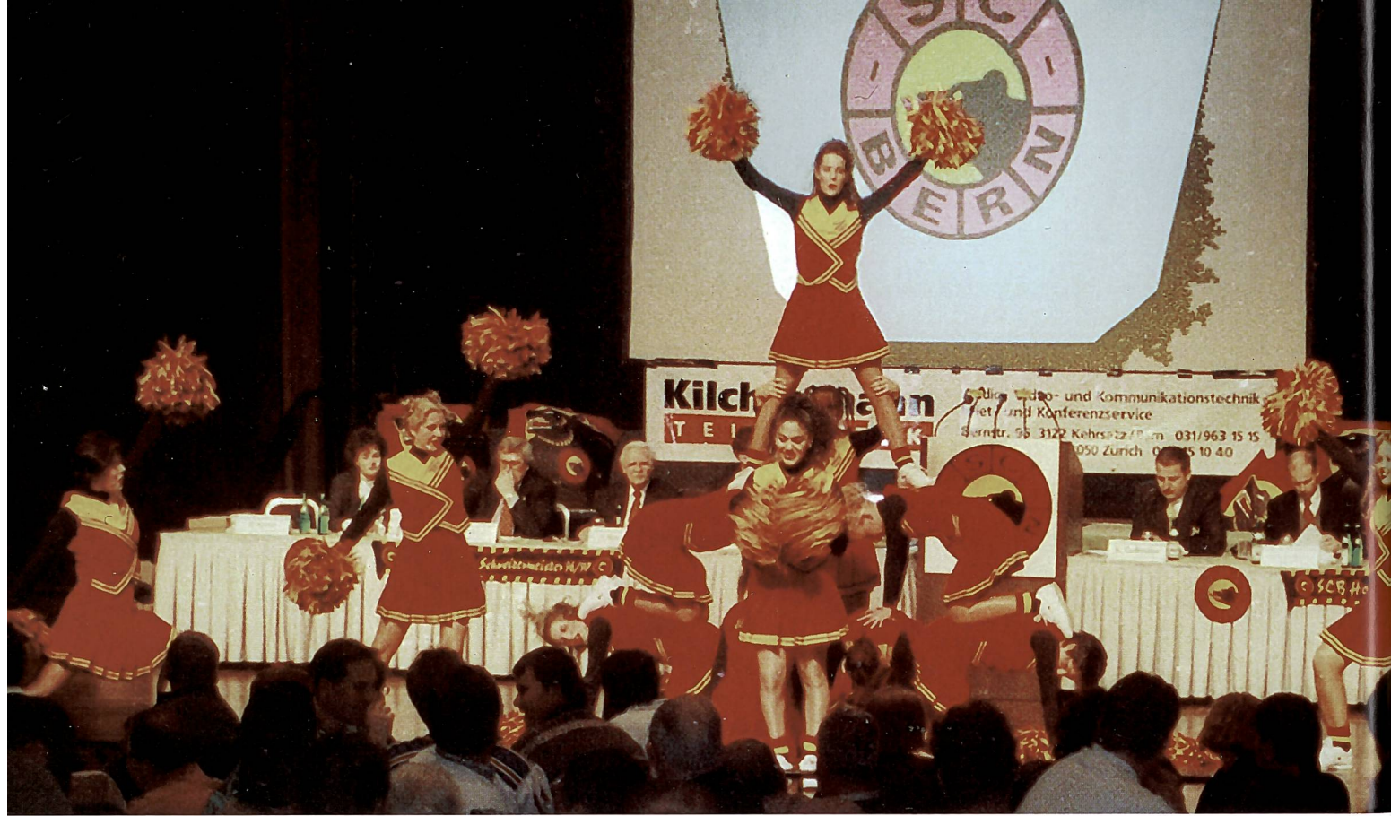
Un tocco femminile nella pista di ghiaccio di Berna grazie alle cheers girls.

nome non è lo stesso su tutte le maglie; ogni tifoso può scegliere fra i 24 giocatori della rosa quello che preferisce. I diversi giocatori non vengono visti dunque come figure di identificazione che rinsaldano la massa; scegliendo di portare la maglia di questo o quel giocatore, il tifoso abbandona la propria identità per aderire a quella della massa, che gli consente di partecipare al rituale del gioco. Per tutta la durata dell'incontro i tifosi sono parte integrante della squadra sul terreno di gioco e si battono per la stessa causa: vincere e imporsi in un gioco, apparentemente liberi da ogni costrizione sociale.