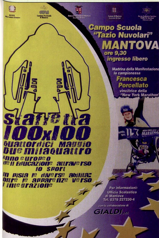
Una staffetta che ha lasciato il segno.