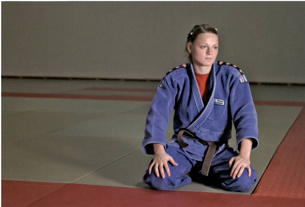
Perché si è deciso di vietare il doping? Per proteggere gli atleti.